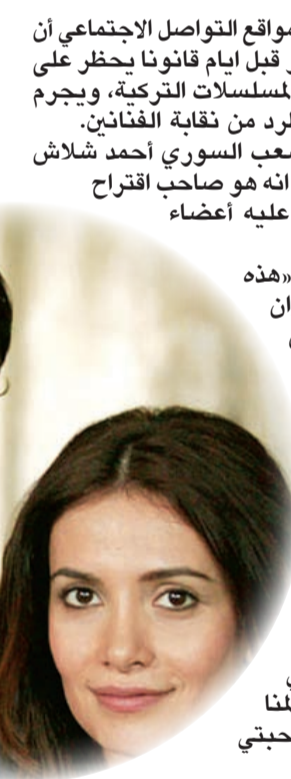
القرار سيؤدي إلى كسادها وخلي يقلعوا شوكن بايدن