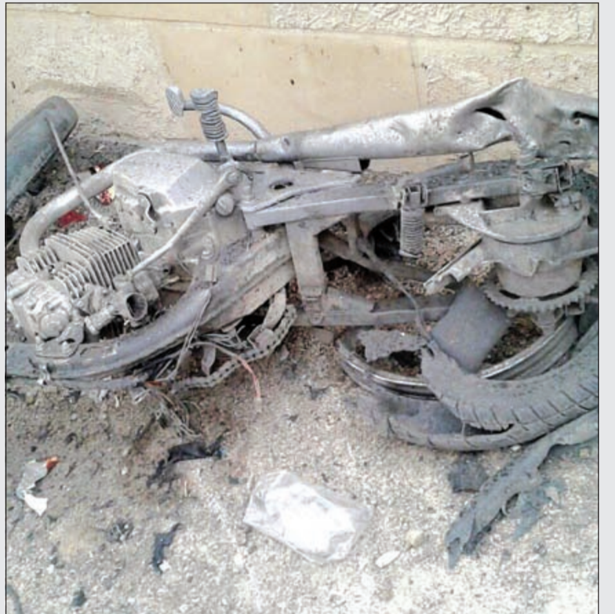
الدراجة كما بدت بعد التفجير عقب استهدافها اجتماع هيئة علماء القلمون

.. ولبنانيون يحاولون اسعاف المصابين جراء الانفجار