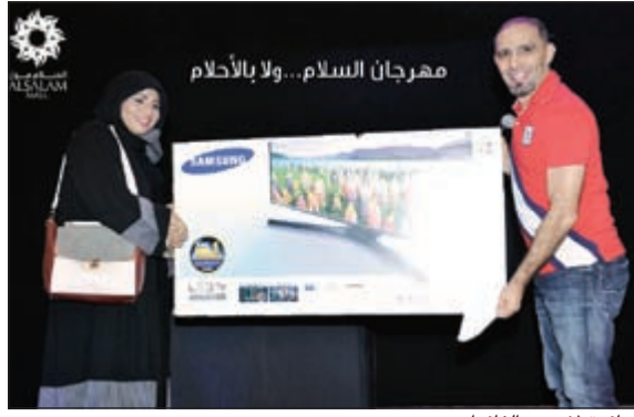
جائزة لإحدى الفائزات