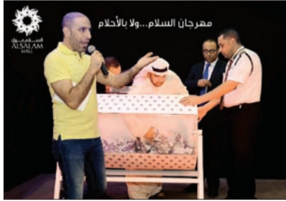
السحب على الجوائز