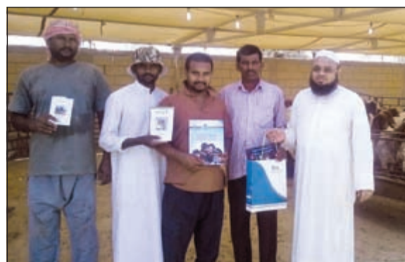
داعية من فرع الوفرة باللجنة يوزع الوسائل الدعوية في البر