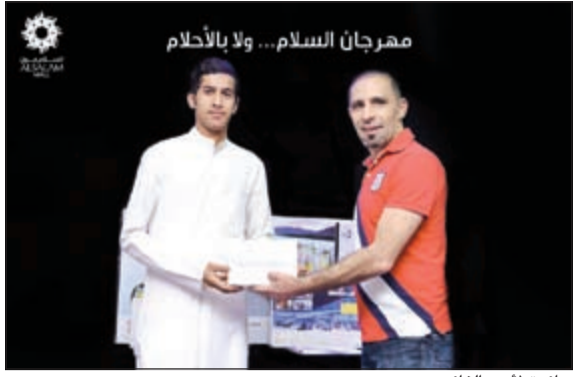
جائزة لأحد الفائزين