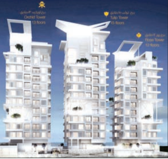
امنيات جاردنز الكويت