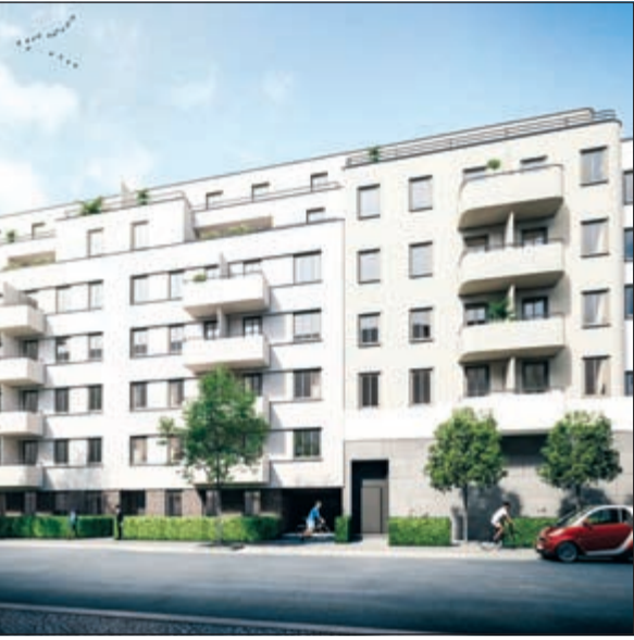
سيتي بارك كوارترز