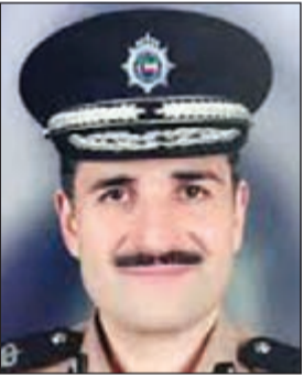
اللواء طلال معرفي

ناشد وافد سوري مدير عام الإدارة العامة لشؤون الإقامة اللواء طلال معرفي النظر لموضوعه بعين العطف الابوي، حيث يقول: أرغب في منح ابنتي سمة دخول وذلك لتجديد إقامتها، حيث أنها تدرس في مدارس الكويت ومقيمة على كفالت بدولة الكويت وانتهت إقامتها في 2015/10/8، هذا وكلي أمل بموافقة معاليكم على طلبي وجعلكم الله ذخراً لنسا وللوطن الكريم المعطاء في ظل الحكومة الرشيدة.