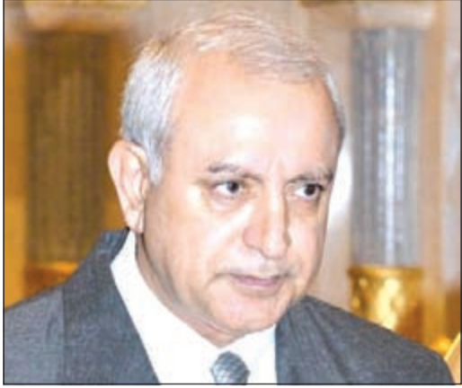
د. بدر العيسى

ناشد رب أسرة من فئة البدون وزير التربية والتعليم العالي بدر العيسى حل مشكلته مع مكتبته مع التعليم الخاص، حيث يقول في شكواه أنه حصل على حكم محكمة يقضي بالزام التعليم الخاص بتسجيل ابنته في المدرسة بعد رفض مما أجبر «البدون» على اللجوء للعدالة والحصول على ما تم ذكره مع النفاذ والزام التعليم الخاص بدفع مصاريف المحاماة. وأضاف الشاكي: رفض التعليم الخاص تنفيذ الحكم عن طريق الماطلة وبعدها ذهبت للنياية العامة وقدمت شكوى بعدم تنفيذ الحكم الصادر، فقدمت بعدها كتاب تظلم لوزير التربية وقام مشكوراً بالتأشير على الكتاب الذي قدمته بلا مانع من تنفيذ الحكم، لكن إدارة التعليم الخاص اخبروني ان وكيل التعليم ومدير ادارة التعليم الخاص اوقفا كتاب التظلم ووضعوا عليه تأشيرة «حسب النظم» ولم ينفذوا الحكم حتى الآن، وابتني مازالت محرومة من الدراسة ذكر انه لا يشترط شهادة الميلاد في التسجيل بمدرسة خاصة كما شرحة القاضي في مسودة الحكم، وكلي امل ان تذهب ابنتي للمدرسة مثل اي طفل.