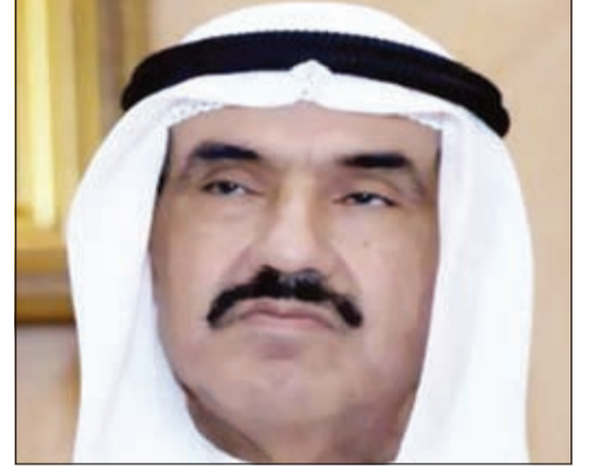
سمو الشيخ ناصر المحمد

ناشد مواطن سمو الشيخ ناصر المحمد مساعدته في حل مشاكله المادية التي أثقلت كاهله خاصة وهو رب أسرة كبيرة.. وقال المواطن في رسالة بعثها لـ «الانباء»: إلى الشيخ ناصر المحمد أنا مواطن ظروف صعبة جدا وأتأمل النظر لحاجتي نظرة الأب الحنون كما هو معروف عن سموكم حيث إنني أعول أسرة من خمسة أبناء وراتبي لا يعينني على متطلبات الحياة المعيشية حيث أنني استلمت أرضي من السكنية بمنطقة صباح الأحمد وجار الآن بناء الأرض ومع ارتفاع أسعار المواد زادت مصروفات البناء ولا املك ذلك المبلغ ولدي قروض من البنك الوطني وشركة التسهيلات علما بانني اسكن حاليا بالإيجار بمبلغ 450 دينارا شهريا والله أعلم بحالي هذه المعاناة.