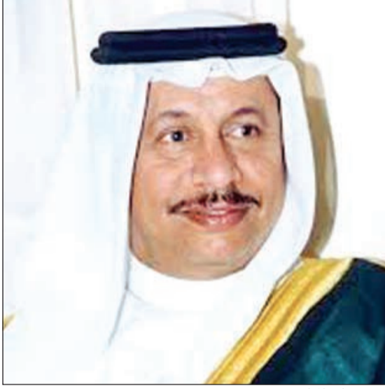
الشيخ جابر المبارك

استنجدت مواطنة بسمو رئيس مجلس الوزراء الشيخ جابر المبارك وبأهل الخير في رسالة حزينة بعثتها لـ «الانباء» والتي بدأت بها: