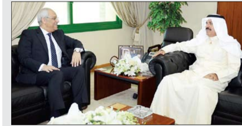
الشيخ أحمد النواف مستقبلاً السفير المصري ياسر عاطف

بالدور الحيوي الذي تقوم به الجالية المصرية في التنمية الاقتصادية بالبلاد. من جهته عبر السفير عاطف عن سعادته بفترة عمله بالبلاد وامتدانه لثقافة الاستقبال، معرباً عن التقدير البالغ للرعاية التي تحظى بها الجالية المصرية على الصعيدين الرسمي والشعبي في الكويت، وأعرب السفير عاطف عن سعادته ببقاء