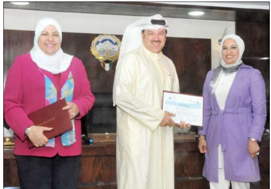
أحد الكرمين تسلم شهادته

لدى الهيئات الحكومية في مصر والكويت». وبين الطباخ أنه يعتمد في أسلوبه الفريد «على مزج اللون بالحرف على سطح اللوحة، حيث يلبس الحرف حالة من الحركة والإيقاع تجعل لوحاته عبارة عن قصائد شعرية كقصائد الشاعر عبدالرحمن الأبنودي»، مبيناً أنه تأثر «بالبيئة الصوتية والروحانية فترجمها إلى لوحات روحانية أكثر منها فنية»، معتبراً «الحرف لا يتوقف عند كونه مرادفاً بل حالة وجدانية، حالة يعيشها الفنان عند رسم لوحاته». وأوضح أن هذا المعرض الثالث له على أرض الكويت التي تأثر الفنان بخطاطبها الكبار فريد العلي ومعراج الهودع».