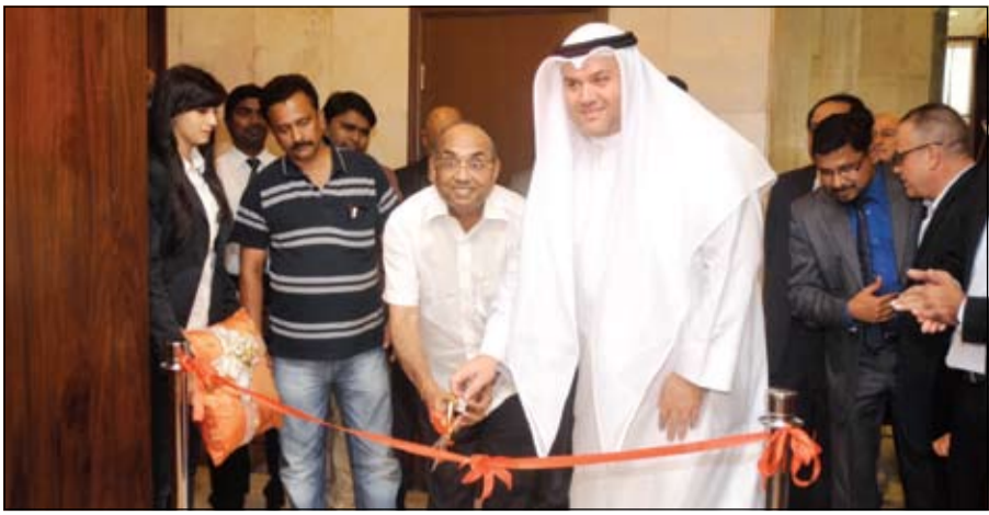
السفير الهندي سونيل جين ورئيس تحرير «كويت تايمز» الزميل عبدالرحمن العليان يفتتحان المعرض

ولتجربة مليئة بالنشاط والحيوية يستنى للمقيمين زيارة مركز اللياقة البدنية المطل على شاطئ الخليج العربي، وللباحثين عن الاسترخاء فيمكنهم التوجه إلى تاليس سبا الحائز جائزة «أفضل منتجع صحي للفترة الفاخرة»، لعام 2015 الذي يعد الملا الأمل للاسترخاء والذي يقدم مجموعة من الحزم التي تناسب جميع الاحتياجات. ولضيوفنا الصغار يوفر الفندق نادي سنديا للأطفال وغرفة سين للمراهقين المليئة بالأنشطة الترفيهية المتعددة واللعاب الفيديو وسينما خاصة بهم. ويتمتع الفندق بموقع مثالي ومتميز على شاطئ الخليج العربي، وقريب من منطقة الأعمال في مدينة الكويت والمطار، والعديد من المناطق الحيوية والجذب السياحي في الكويت.