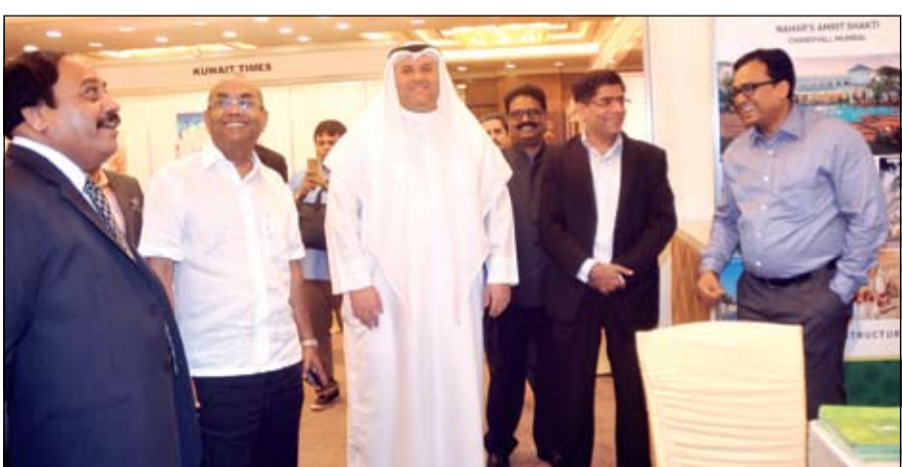
.. وجولة في المعرض