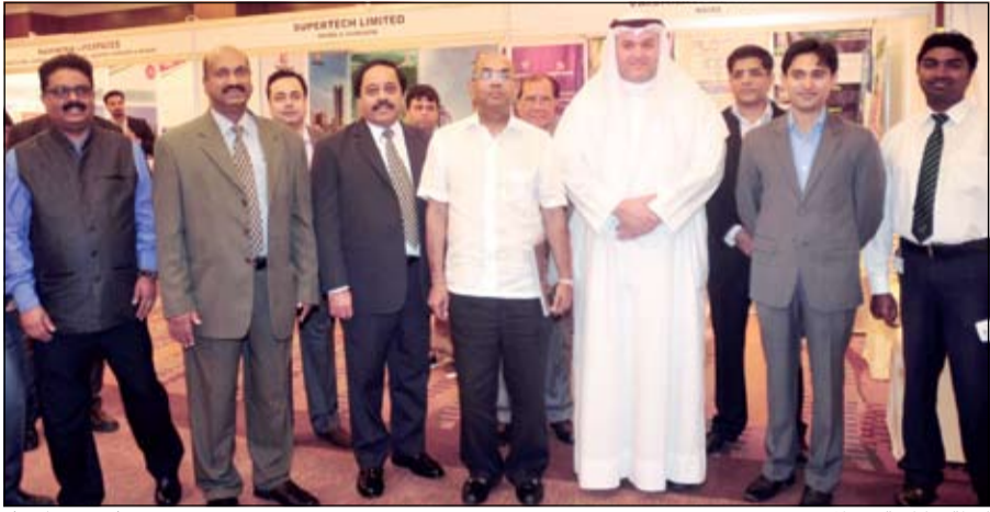
لقطة تذكارية في المعرض