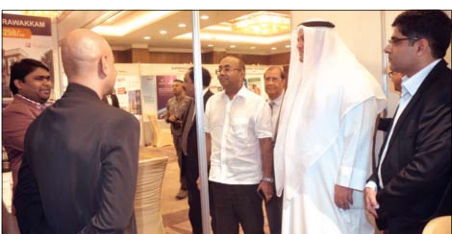
الاستماع لبعض المشاركين في المعرض