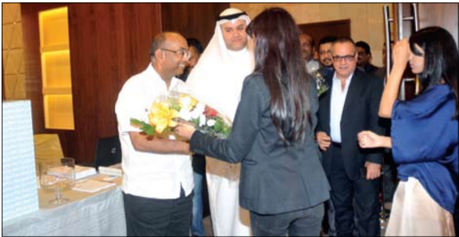
باجة زهور للسفير الهندي

في بوتيكات جيجير لوكولتر، ستستكون ساعة غراند ريفرسو ليدي ألترا ثين دويتو ديو مرصعة بسوار جلد من الشركة الإيطالية الشهيرة فالكسترا. وفي 1997 استشر المصنع ربح التغيير والتطوير لمبدأ تصميم دويتو لتحظى السيدات بساعتين في ساعة واحدة: بحركة ناعمة صغيرة،