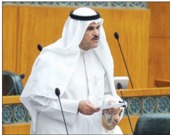
الشيخ سلمان الحمود متحدثا