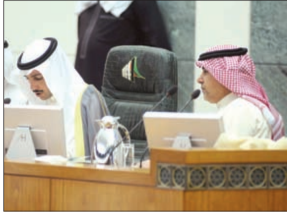
عبدالله التميمي بجانب الرئيس الغانم على المنصة