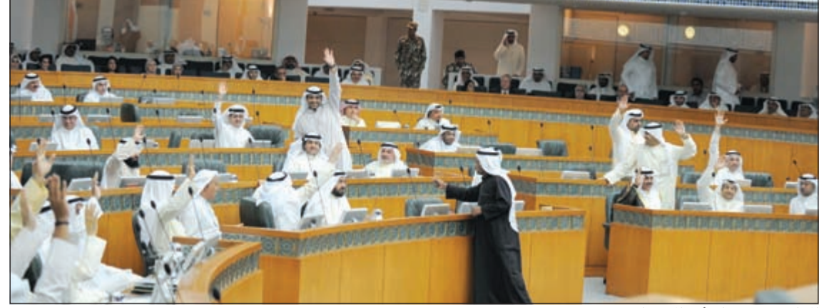
المجلس يصوت على أحد المقترحات