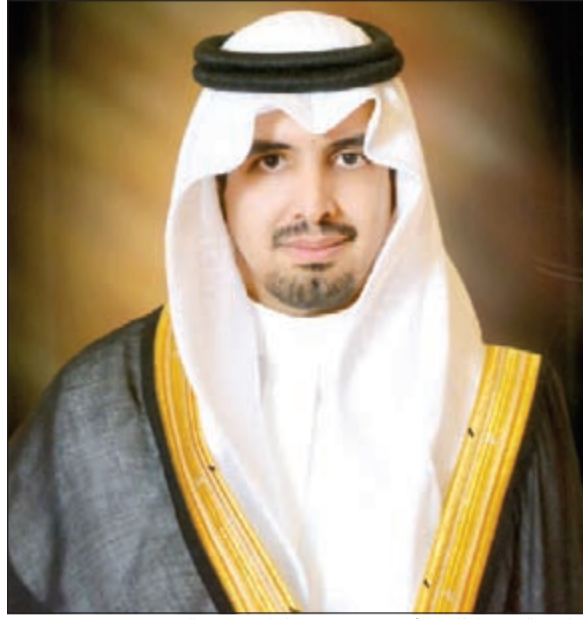
صاحب السمو الملكي الأمير سعود بن سلمان بن عبدالعزيز

ويأتي اختيار سمو الأمير سعود بن سلمان بن عبدالعزيز من قبل الجمعية خلفاً لصاحب السمو الملكي الأمير محمد بن سلمان بن عبدالعزيز ولي العهد الذي حالت مشاغله دون استمراره في الرئاسة الفخرية للجمعية، وبعد قبول الأمير سعود بن سلمان للرئاسة الفخرية لفئة كريمة منه وفي لحظة تاريخية ومفصلية ويعد تكريماً لكل الإداريين المخلصين في إطار الجمعية.