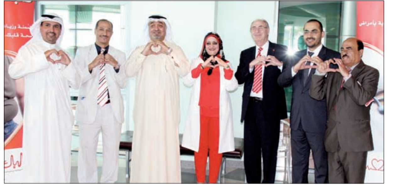
جانب من المشاركة في يوم القلب العالمي