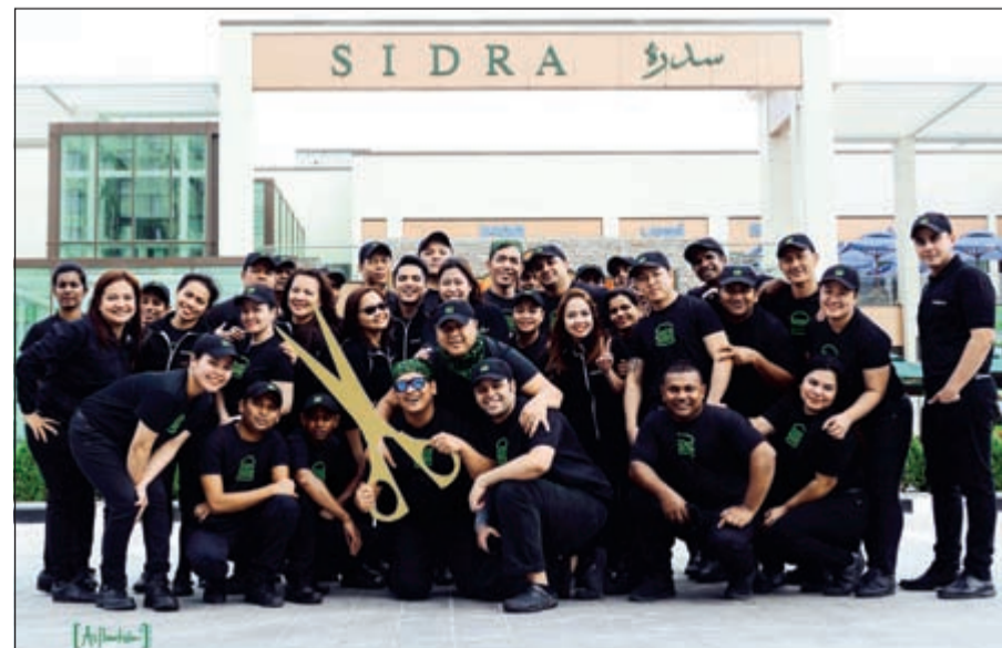
فريق عمل «شيك شاك».