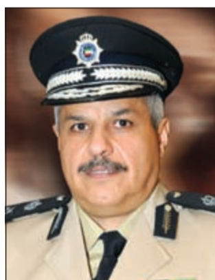
اللواء الشيخ مازن الجراح

قدمه لنائب وزير الخارجية قائلاً انه رغم طلبه (السفير الهندي) وقف استقدام العمالة المنزلية إلا ان وزارة الداخلية أصدرت سمات دخول بطرق ملتوية، وهذا ما لا يجوز باعتباره يتعارض مع رغبة السلطات الهندية، وعليه صدر القرار. من جهة أخرى، حذر اللواء الشيخ مازن الجراح جميع الموظفين من عواقب التفاوض عن طلب أصول الأوراق الثبوتية خاصة عقود الزواج مع حتمية أن تكون موثقة. على صعيد آخر، أبلغ مصدر أمني «الأنباء» بأن نائب رئيس مجلس الوزراء ووزير الداخلية الشيخ محمد الخالد صعد ترقية 800 ضابط من مختلف الرتب باعتبار ان ترفيتهم دورية، وذلك قبل قدوم شهر ديسمبر، مشيراً إلى ان عددا كبيرا يصل إلى 304 ضباط برتبة مقدم ستم ترفيتهم إلى رتبة عقيد.