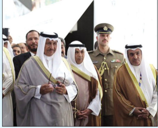
سمو الشيخ جابر المبارك في جناح الكويت