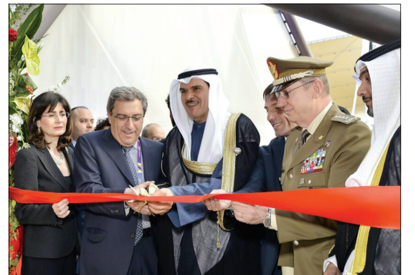
الشيخ سلمان الحمد يقص الشريط