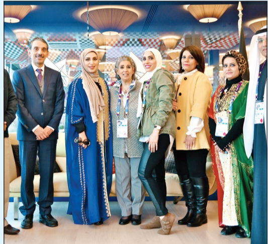
فريق عمل متميز