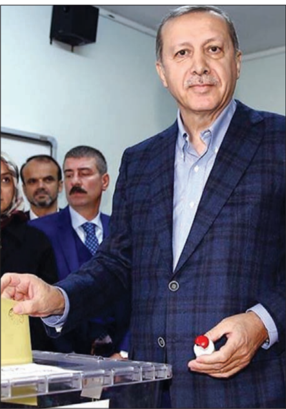
استنبول - خلود عبدالله الخميس ووكالات

استعاد حزب الرئيس رجب طيب اردوغان أمس الأحد الغالبية المطلقة التي كان خسرهما قبل 5 اشهر، بعد فرز كامل بطاقات الاقتراع بحسب نتائج شبه نهائية للانتخابات التشريعية نشرتها القنوات الاخبارية، حيث حصد حزب العدالة والتنمية 49.3% من الأصوات ما يؤمن له 316 مقعداً من أصل 550 في البرلمان، وفق قناتي «ان تي في» و«سي أن أن-توروك»، وقال رئيس الوزراء احمد داود اوغلو مساء أمس امام انصاره في قونيا اثر اعلان النتائج: «اليوم هو يوم انتصار»، مضيفاً ان «الانتصار هو ملك الشعب»، ووجه نداء الى الوحدة في تركيا قائلاً: «ليس هناك اليوم خاسرون بل فقط رابحون». وخاطب أوغلو الناخبين الذين لم يصوتوا لحزب «العدالة والتنمية» بعدم الشعور بـ «الهزيمة»، قائلاً: «اليوم لا يوجد مهزوم، وإنما يوجد منتصر، هو أممتنا، وجهورييتنا، وديموقراطيتنا»، وبعد ذلك قارا كيرا لاردوغان (61 عاماً) الذي كان حزبه فقد الأكرية المطلقة وبالتالي السيطرة الكاملة على السلطة التي تمتع بها طيلة 13 عاماً. وحصد حزب الشعوب الديموقراطي الموالي للاكراه 10.4% من الأصوات. فيما حصل حزب «الشعب الجمهوري»، برئاسة كمال قليجدار أوغلو، على نسبة