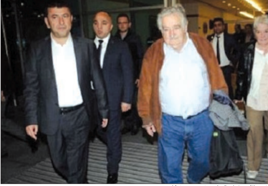
رئيس الأوروغواي السابق، خوسيه موكيكا

انتهت ولايته 1800 دولار نقداً، إضافة إلى الفولكس 1987 طراز «بيتل» القديم، مع بيته الرخيص بالأرياف، حيث يعمل هو وزوجته في الحقل وزراعة الأزهار، ولا يحرصه إلا جندبان وكلبة لها 3 أرجل اسمها مانويلا.