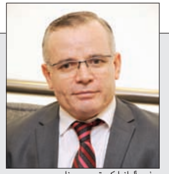
سفير ألبانيا كورتيم مورينا

السفير الألباني: تنطلق لزيارة صاحب السمو إلى ألبانيا 04 في الخليج 35