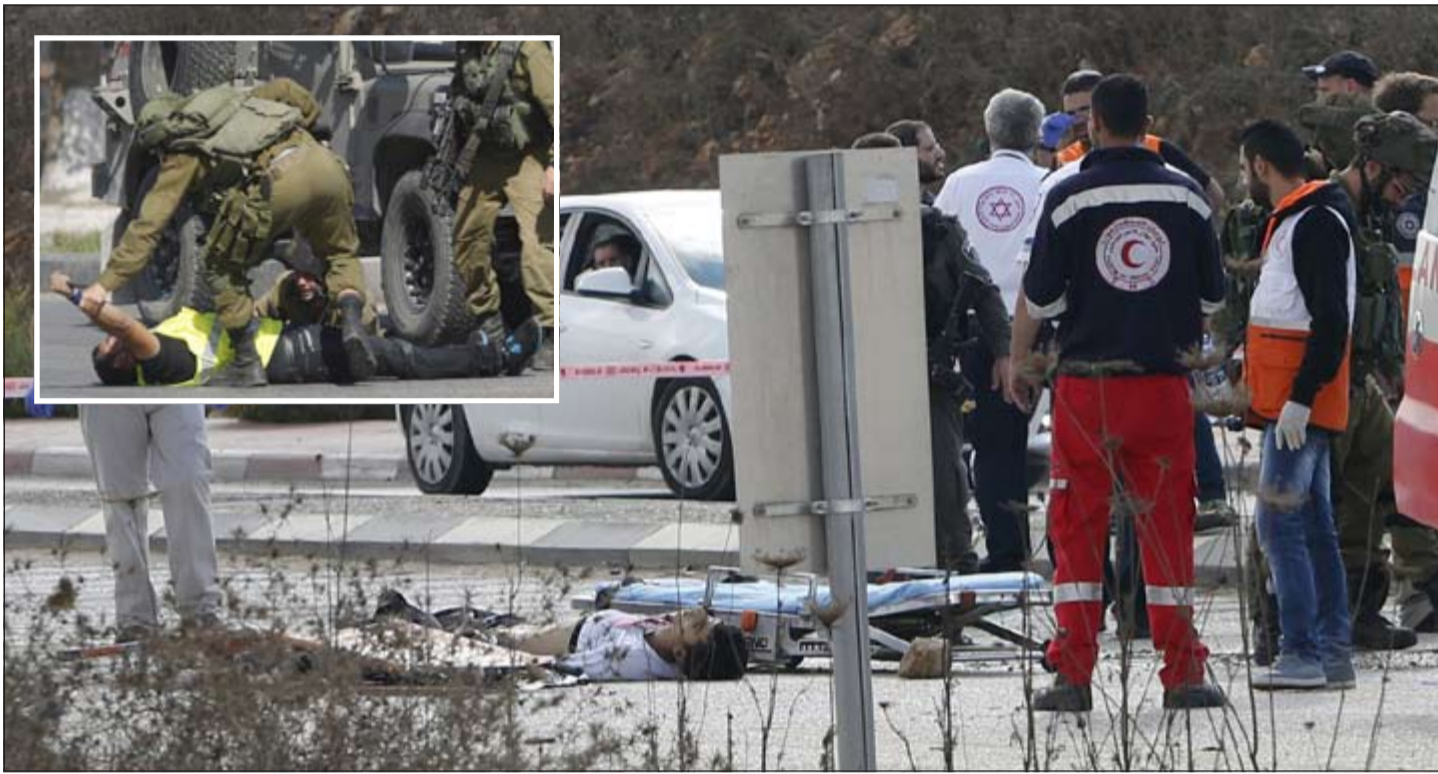
جثة الشهيد الفلسطيني على الأرض بعد إطلاق النار عليه برصاص جنود إسرائيليين بالضفة الغربية. وفي الإطار جندي مسك بيد الشاب الفلسطيني الذي طعن إسرائيليا أمس

الضفة الغربية وقطاع غزة من الوصول إلى القدس ومنها إلى المسجد الأقصى، رغم أنها تسمح كل جمعة لعدة مئات من سكان غزة بالصلاة في المسجد ولكن بعد الحصول على تصاريح خاصة. وقد انتشرت قوات من الشرطة على مداخل البلدة القديمة وفي أزقتها وعند بوابات المسجد الأقصى حيث أوقفت الشبان بشكل عشوائي للتدقيق في هوياتهم. ودعا الشيخ يوسف أبو سنينة، في خطبة الجمعة بالمسجد الأقصى، إلى إنهاء الاحتلال الإسرائيلي للأراضي الفلسطينية ووقف العقوبات الإسرائيلية ضد الفلسطينيين. كما أدى المصلون صلاة الغائب على أرواح الفلسطينيين الذين قتلوا برصاص القوات الإسرائيلية، وترفض السلطات الإسرائيلية تسليم جنائهم لدويهم حتى الآن. وبتزامن هذا مع اندلاع مواجهات في مواقع متفرقة من الضفة الغربية المحتلة، بين الفلسطينيين والجيش