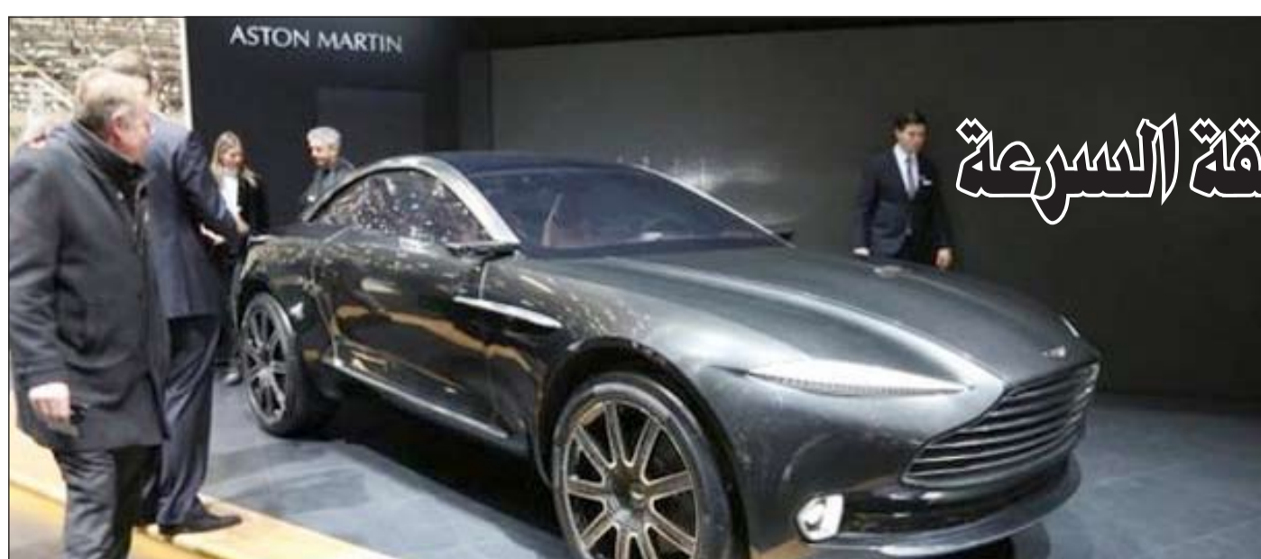
«أستون مارتن» تطور سيارة رايب لتكون أسرع سيارة كهربائية

بحسب وكالة الأنباء الألمانية نقلته «العربية.نت». وبحسب الشركة فإن البطاريات القوية الموجودة في السيارة ستتيح قطع مسافة تصل إلى 320 كيلومتراً قبل الحاجة إلى إعادة شحن. يذكر أن أستون مارتن تنتج السيارة «رايب» منذ 2010، وتم إصدار نسخة محدثة منها مزودة بمحرك كهربائي مزدوج بقوة تصل إلى 550 حصاناً.