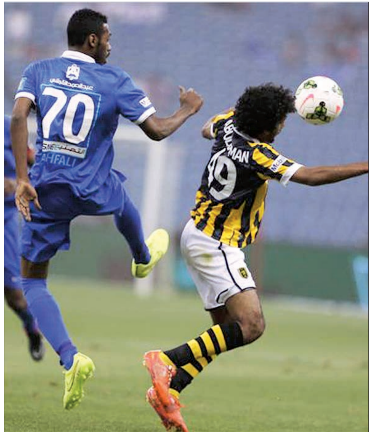
المصراع سيكون مثيرا بين لاعبي الاتحاد والهلال

أبطال آسيا وبات التفكير في الدوري فقط. ويرحل الاهلي الى مكة من اجل ملاقاته نجران الذي تم نقل مبارياته اليها بسبب الظروف الحالية التي تعيشها المنطقة الجنوبية واكثر ما يقلق الاهلي هو ذكريات الموسم الماضي الذي فقد فيه اللقب بسبب التعادلات مع فرق الوسط في وقت كسب فيه من حمل اللقب ذهابا وايابا، بينما من جانب نجران الذي مازال يقع في مركز متأخر بالرغم من اجتهادات مدربه التونسي فتحى الجبال الذي قاد الفتح للقب عام 2013.