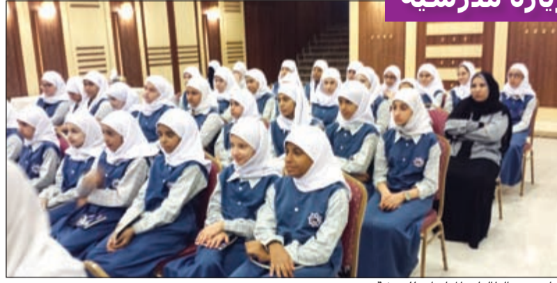
جانب من المطالبات المتابعات للورشه