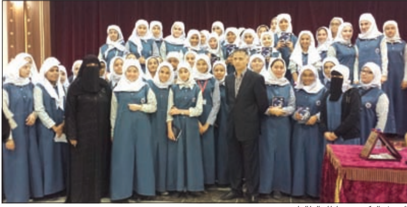
الزميل البكري يحاطا بالمطالبات