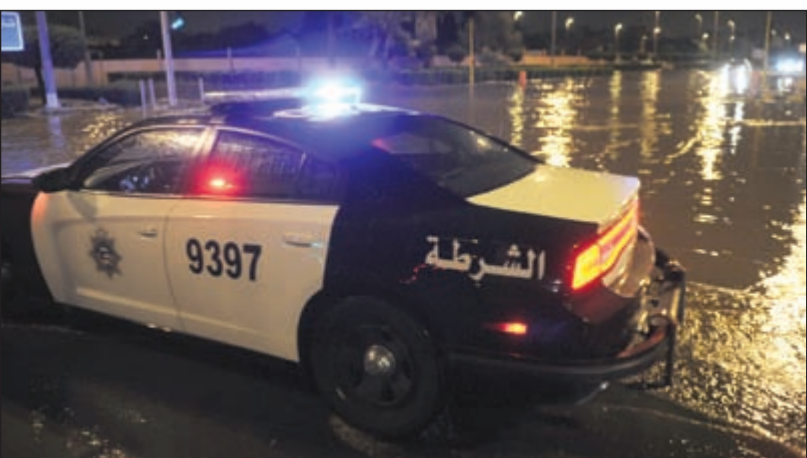
سيارات الشرطة في أحد المواقع