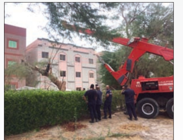
رفع إحدى الأشجار بعد سقوطها

من جانبه، أعلن الناطق الرسمي بوزارة الأشغال والوكيل المساعد لقطاع التخطيط والتنمية م. عبدالمنعم العنزي أنه تم تشكيل غرفة عمليات منذ ساعات الفجر عند بدء تساقط الأمطار وسوء الأحوال الجوية ممثلة بالوكيل المساعد لقطاع هندسة الصيانة وجميع مديري المحافظات بإدارة الطرق وكذلك قطاع الهندسة الصحية. وأكد العنزي في تصريح وجود تنسيق كامل مع إدارة العمليات بوزارة الداخلية وإدارة الدفاع المدني وهيئة الأرصاد الجوية في ظل سوء الأحوال الجوية التي تمر بها البلاد. وأضاف أنه تم التعامل مع جميع الشكاوى التي وردت كما تم تصريف جميع تجمعات المياه منذ الساعة الأولى للأمطار، مؤكداً أن فرق