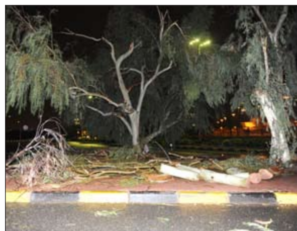
سقوط الأشجار بفعل قوة الرياح