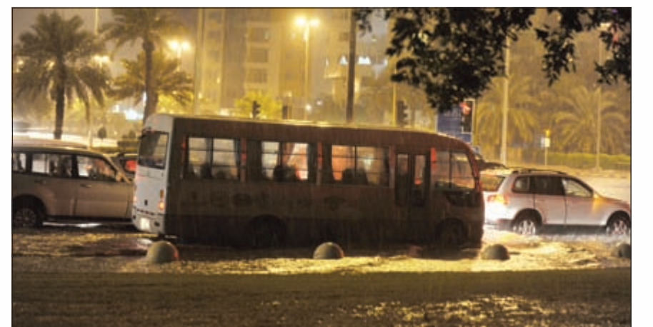
السيارات تخوض في برك من المياه