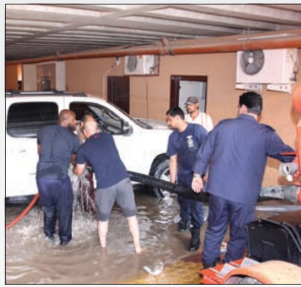
سحب المياه من أحد المواقع