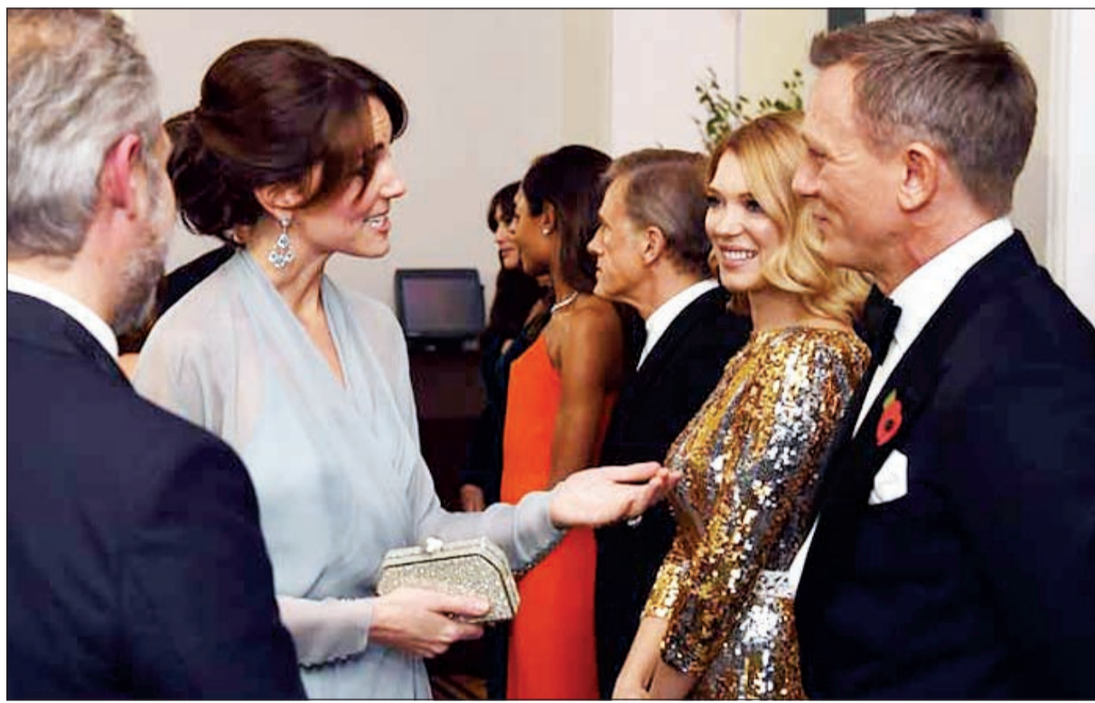
كيت ميلنغتون مع أبطال الفيلم

وكان دانييل كريغ قال اخيراً «إنجاز فيلم بعد (سمايفال) كان تحدياً كبيراً، إذ ان الجزء الاخير من هذه السلسلة حقق أكبر العائدات مع أكثر من مليار دولار. ويشير عنوان الجزء الرابع والعشرين من أفلام العمل 007 في السينما إلى المنظمة الإجرامية «سبيشلس إكزيكوتيف فور كاؤنتر انتليجنس، تيروريزم ريفنج اند إكسكورشن» التي تختص بالإنجليزية بكلمة «سبيكتر». ويعود آخر ذكر للمنظمة إلى العام 1971 في «داميندر آر فوريفر» بسبب خلاف على الحقوق بت به قبل سنتين، علماً أنها ظهرت للمرة الأولى على الشاشة سنة 1962 في «دكتور نو». وقال كريغ «كننا ننظر بفارغ الصبر ان نتمكن من احياء سبيكتر». وصور الفيلم الجديد في إنجلترا وإيطاليا والنمسا