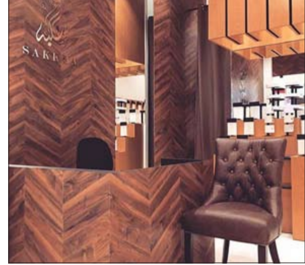
معرض «سكبة» في برج «التجارية»