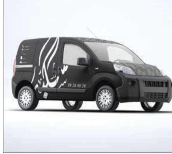
سيارة خاصة لتوصيل الدشاديش بعد إنجازها للعملاء في كل مكان