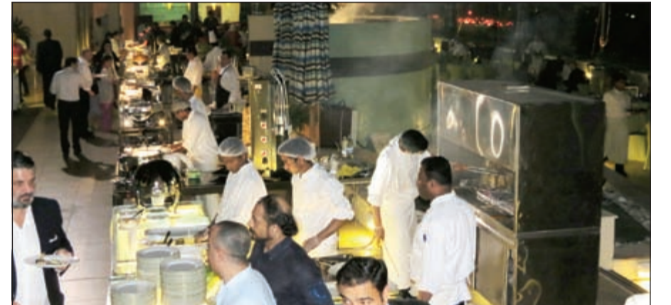
جانب من ليالي الباربيكيو في فندق ميسوني