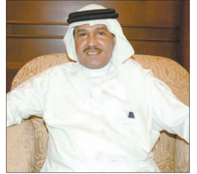
فنان العرب، محمد عبده

تقرر أن تكون الحلقة الأخيرة من برنامج «فنان العرب» لاكتشاف المواهب الغنائية 6 ديسمبر المقبل، وهو البرنامج الذي يشارك في لجنة تحكيمه سفير الأغنية الخليجية عبدالله الرويشد والنجمة أصالة والمحن عصام كمال، وضيف شرف ونجم البرنامج «فنان العرب» محمد