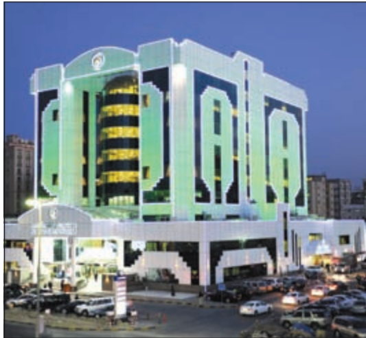
مستشفى دار الشفاء صرح طبي متميز

والحصول على الاعتمادات والتعاقدات الدولية واحدا تلو الآخر. ففي عام 2009 تم الاحتفال بإعلان مركز التدريب «مركزا دوليا مستقلا لتدريب الإنعاش القلبي الرئوي الأساسي». وفي نوفمبر 2009 زار وفد من جمعية القلب الأميركية المركز للاطلاع على جهوزيته للتقييم النهائي للحصول على الارتباط المباشر مع الجمعية وتسمية مركز التعليم المستمر في المستشفى «مركزا دوليا لتدريب برامج جمعية القلب الأميركية». وتتجلى رؤية