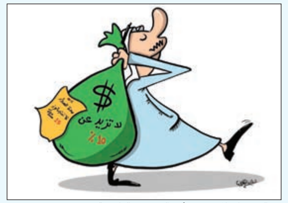
من الرسومات المعبرة عن أحد النصوص القانونية