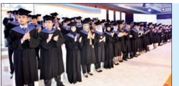
خريجو برنامج البكالوريوس في الكلية الاسترالية

مجموعة الشيبب: لا انخفاض في أسعار العقار بالفترة المقبلة.. حتى مع تراجع الطلب نصائح قبل شراء العقار وتوقيع العقد