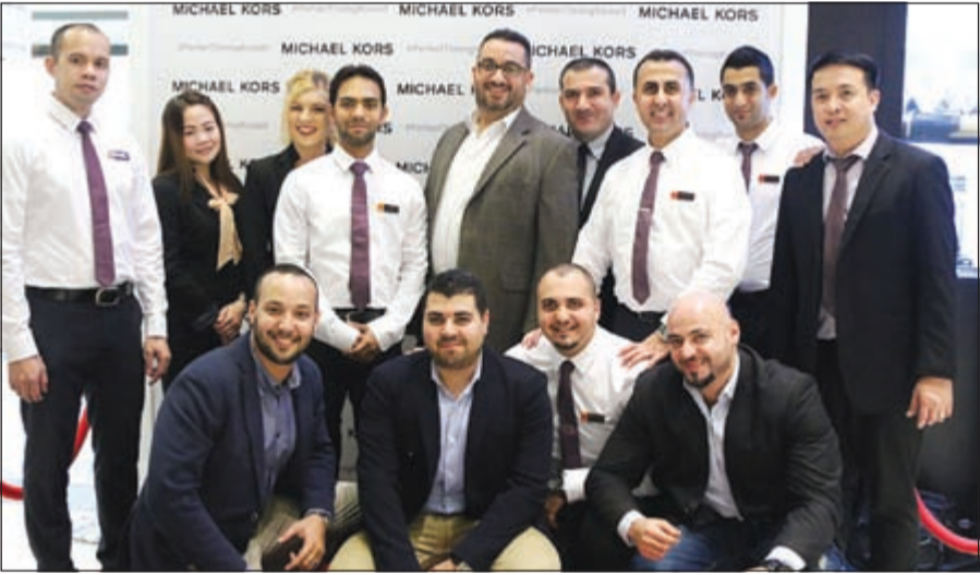
فريق عمل «أون تايم»

الكرونوجراف لقياس الوقت. كما تضم تشكيلة الساعات الرجالية تصميم (Brecken)، الذي يتسم بأناقته، حيث تصمم المينا البسيط والأرقام الرومانية الشهيرة. وتضم التشكيلة تصميماً مصنوعاً من الستانلس ستيل الفضي أو اللون الذهبي المائل إلى الوردى بأسوار أسود، ويعد اللوزين البني والأسود أهم ملامح تشكيلة الرجال لخريف 2015 من مايكل كورس. وللتعرف على تشكيلة مايكل كورس لخريف 2015 يمكنكم زيارة أي من أفرع «أون تايم» بالكويت من بينها مجمع الأفتنيوز، ومارينا مول، ومجمع البريق، وذا جيت مول، وأوناد الجبراء، ومجمع الكوت، ومول 360، وفرع المطار، ومجمع المهلب، ومجمع الفنار وديسكفري مول.