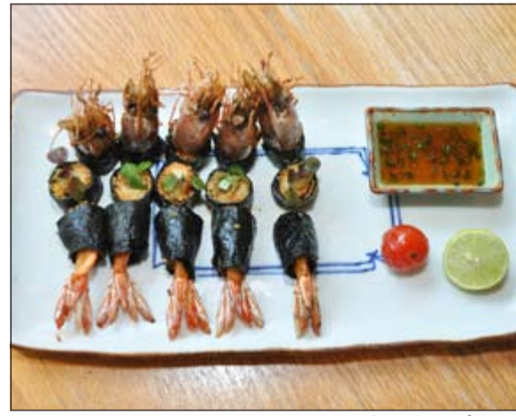
أشهى المأكولات البحرية

يضاف إليها قطع السلطعون المنكه بمرق التفاح التي تغني الحواس قبل المذاق وتجعلك في توق إلى تذوق المزيد، وتقدم