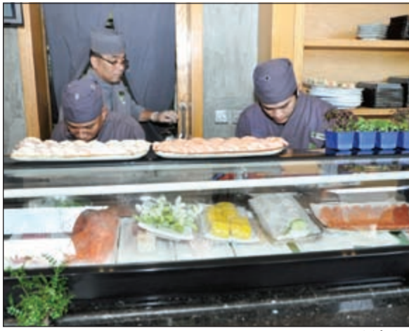
إعداد أطباق مميزة

الربيان، التونا، ولعل أكثرها طلباً هي لفائف ابي كاتسو وفوغاكيو تمبوورا مع الأفوكادو التي تقدم مزيجاً ممتعاً وشهيلاً للراغبين بتدليل حاسة الذوق لديهم أيضاً اغناء البصر بتشكيلة رائعة من اللفائف اليابانية الأصيلة. وثمة طبق قد لا يفوت لدى «وسابي ايزاكايا» والمؤلف من الكرنكس المبلل بخلطة حرة وحلوة في آن وطبق سمك السالمون مع صلصة التبري التي تقدم مع أطباق جانبيه منها الأرز، النودلز مع الخضار التي يمكن الإضافة إليها خيارات من فمار البحر، اللحم أو الدجاج. كما يستطيع العملاء أيضاً الاختيار من بين كم غني من الأطباق الجانبية من ضمنها التامبوروا والسلطات