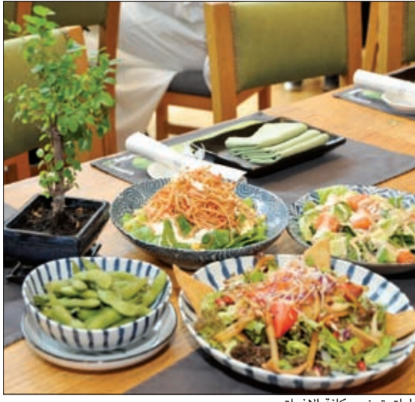
أطباق ترضي كافة الذواق