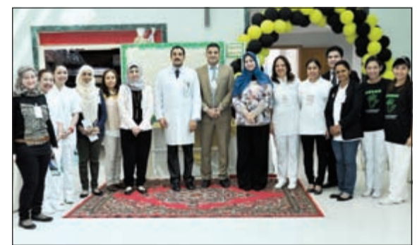
طاقم «السلام الدولي»، خلال الفعالية

وتشدد على ضرورة عمل جميع المستشفيات على تحسين الأداء والارتقاء بنوعية وسلامة الخدمات المقدمة للمرضى، لأن تحسين هذه النتائج سيؤدي إلى انخفاض معدلات إعادة الرعاية الصحية للمرضى وانخفاض معدلات الإصابة بالعدوى للمستشفيات وقلة الأخطاء الطبية فيها.