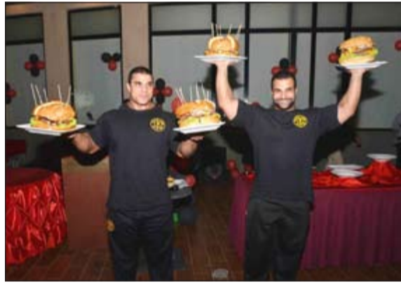
عرض مونستر برغر من قبل فريق جولدن جيم