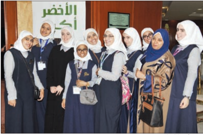
مجموعة من المكيمات