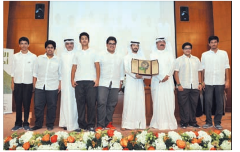
طلاب إحدى المدارس يتسلمون تكريمهم

والتدمير التي تتعرض له جميع مرافق الهيئة ممثلة بالحدايق والزراعات التجميلية والشواطئ والمرافق العامة بشكل عام. وعبرت عن شكرها لوزارة التربية ممثلة بجميع المناطق التعليمية وإدارة الأنشطة التربوية للمشاركة بفعاليتها الإدارية والتربوية والطلبة وكذلك جميع الجهات والشركات التي شاركت في دعم مشروع «الأخضر» من خلال مساهمتها في دعم مشاريع الزراعات التجميلية والمشاريع البيئية والزراعية.