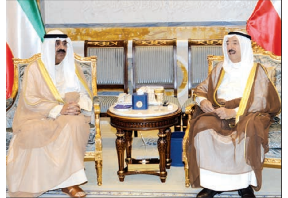
صاحب السمو الأمير الشيخ صباح الأحمد لدى استقباله نائب رئيس الحرس الوطني الشيخ مشعل الأحمد

24 مدينة صباح الأحمد السكنية المتكاملة.. دون خدمات!