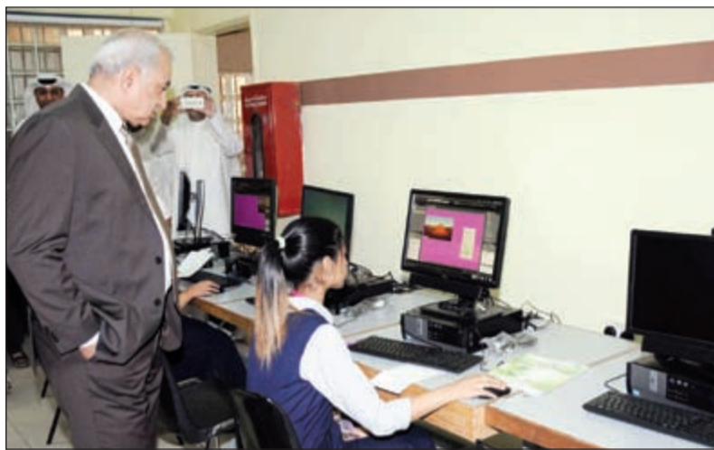
... ويطلع على تدريبات إحدى الطالبات على جهاز الحاسوب