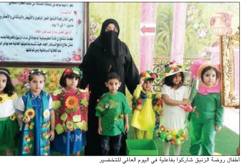
أطفال روضة الزنبق شاركو بإفغالية في اليوم العالمي للتخضير