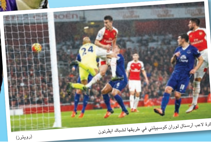
كرة لاعب أرسنال لوران كوسيليني في طريقها لشباك إيفرتون