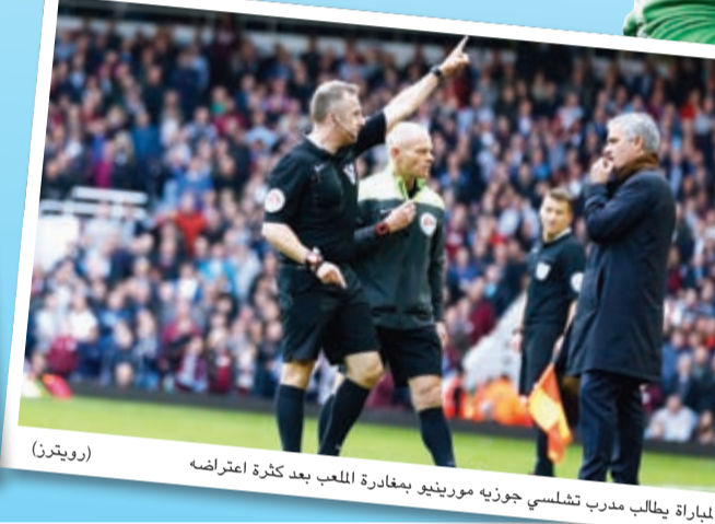
حكم المباراة يطلب مدرب تشلسي جوزيه مورينيو بمغادرة اللاعب بعد كثرة اعتراضه

الملك ي ضرب سلتا فيغو بـ «الثلاثة».. وبايرن ميونيخ 10 على 10