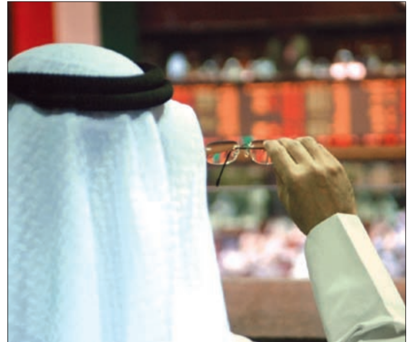
نظرة في الأفق.. انتظار التداولين لانعكاس تطبيق اللائحة التنفيذية لهيئة أسواق المال على أسهمهم بالبورصة الكويتية

توقعات بتفعيل اللائحة في 10 نوفمبر رغم كثرة المقترحات