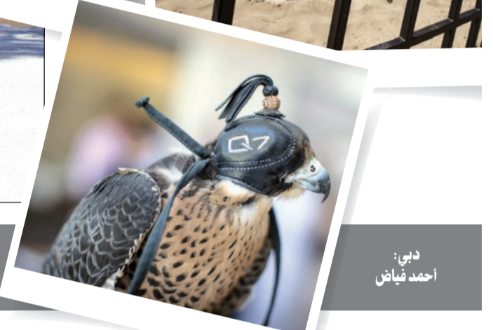
دبي: احمد فياض