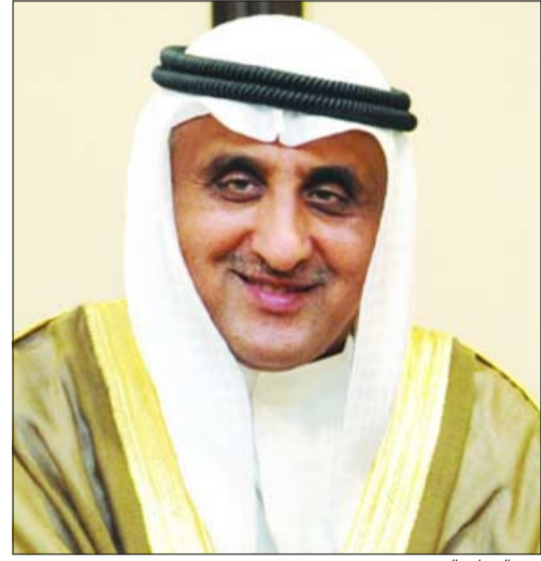
عبد الوهاب البدر

قال مدير الصندوق الكويتي للتنمية الاقتصادية العربية عبدالوهاب البدر أن الصندوق يقدم القروض بشروط ميسرة لتمويل مشروعات التنمية في الدول النامية، كما يقدم المساعدات الفنية لتمويل دراسات الجدوى للمشروعات وتدريب المواطنين في الدول المتلقية لهذه القروض والمساعدات. وكان البدر يتحدث في مقابلة خاصة مع مجموعة اوكسفورد بيزنس جروب البريطانية للأبحاث والنشر والإعلام في معرض رده على سؤال حول ماهية توزيع قروض الصندوق من الناحيتين القطاعية والجغرافية، حيث أشار إلى أن الصندوق يساهم أيضا في تمويل موارد المؤسسات التنموية الإقليمية والدولية، موضحا أن أكثر من 50٪ من قروض الصندوق تقدم لدول عربية فيما يذهب الباقي لدول وأقاليم نامية أخرى، ومن حيث التقسيم القطاعي قال إن قطاعات النقل والطاقة والزراعة تحصل على نصيب الأسد من القروض، حيث أنها تحظى بأولوية قصوى من قبل الدول الأخرى الشريكة له.