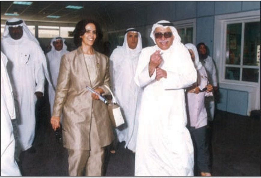
..وفي حفل العيد الوطني برعاية الشبيخة أمثال الأحمد