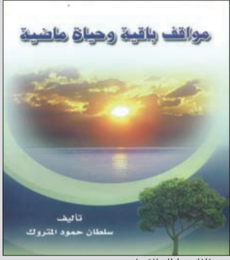
من مؤلفات سلطان المتروك