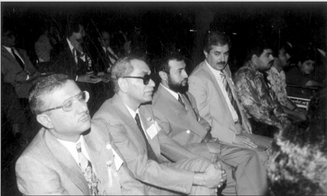
المتروك مشاركا في مؤتمر التاميل المهني - نيوبري 1992

وكانت البعثة الدراسية في القاهرة مدتها سنتان وحصلت على الدبلوم ورجعت إلى الكويت وعينت في مدرسة التربية الفكرية للبنين من عام 1971 إلى عام 2008. في تلك المدرسة منذ تعييني حتى التقاعد، وعرضوا