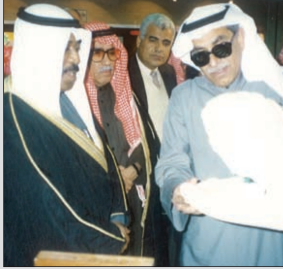
..وخلال معرض انتاج المعاقين بجمعية المعلمين الكويتية تحت رعاية محافظ العاصمة آنذاك الشيخ علي عبدالله السالم