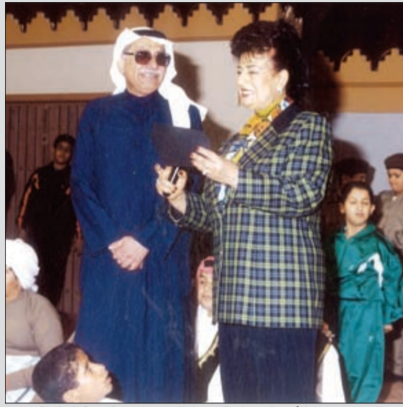
..وخلال برنامج ماما أنيسة وعيال الديرة لطلاب مدارس التربية الخاصة