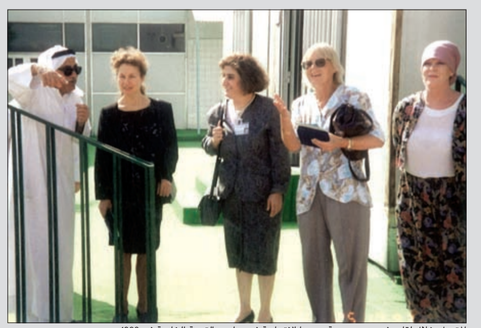
المتروك خلال لقاء وفد من جمهورية روسيا الاتحادية في مدارس التربية الخاصة في 1993