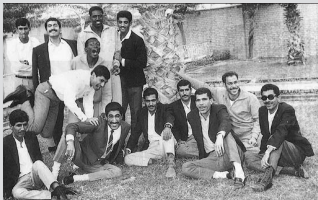
سلطان المتروك مع مجموعة من طلبة معهد المعلمين 1966

عينت بمدرسة التربية الفكرية عام 1971 واستمرت في العمل بها حتى التقاعد عام 2008