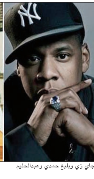
جاي زي وبلينغ حمدي وعبدالحليم