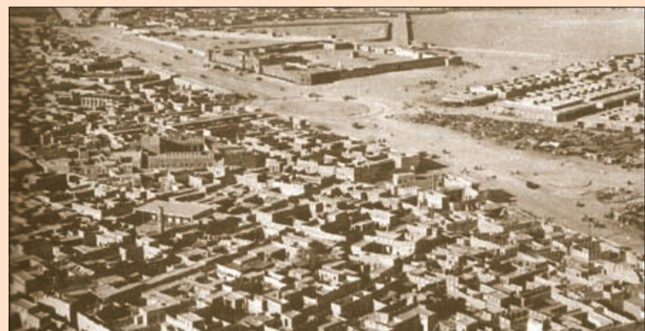
منطقة الشامية من الجو

ويبرز قصر الأمير الراحل الشيخ أحمد الجابر الصباح بوصفه أول مبنى شيد في الشامية، وذلك في ثلاثينيات القرن الماضي وتم استخدامه من قبل شركة النفط الأميركية المستقلة فترة من الزمن حتى تنميته عام 1962 ومن بعدها تقرر تخصيصه لوزارة التربية، حيث استخدم كمقر لدار المعلمين وأضحى اليوم كلية التربية الأساسية للبنات التابعة للهيئة العامة للتعليم التطبيقي. ومن العائلات التي سكنت الشامية: النفسي والغائم والمعتمات والسايح والمشعل والخبيزي والمسند والعبيد ويوسلي وتضم الشامية إحدى أفضل الجمعيات التعاونية في الوطن العربي، حيث تقدم جمعية الشامية