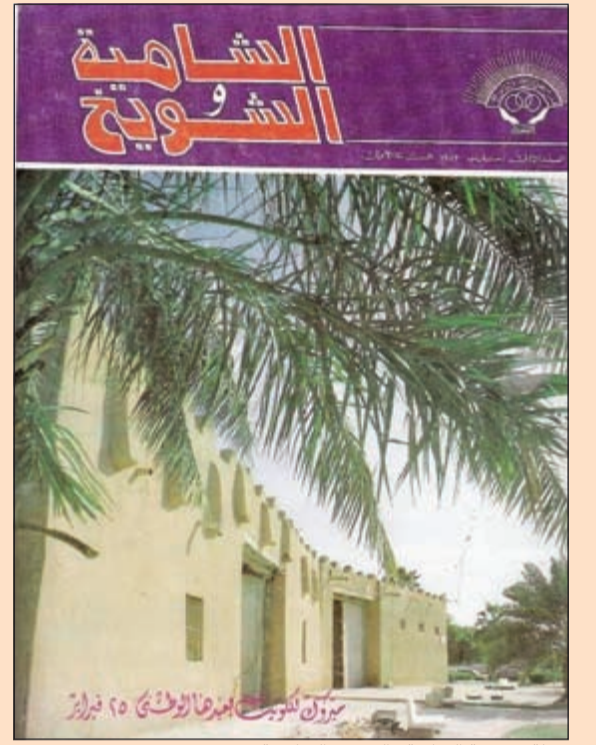
مجلة «جمعية الشامية والشويخ التعاونية»