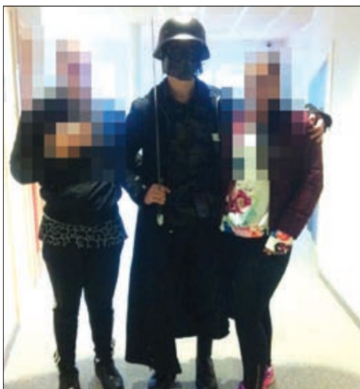
صورة التقطت بواسطة أحد الطلبة في المدرسة المنكوبة ويظهر فيها الرجل المثلث المسلح بالسيف مع اثنين من الطلبة قبل الهجوم في مدرسة يتروهلان جنوب غرب السويد.

د.ب. أفادت تقارير إعلامية بأن مهاجماً ملثماً يحمل عدة أسلحة «مثل السكاكين» قتل مدرسا وصبياً في مدرسة غربي السويد أمس الخميس وترك اثنين آخرين بين الحياة والموت. وأفادت صحيفة داغينز نيتير اليومية بالسويد، بأن الشرطة أطلقت النار وقتلت المهاجم البالغ من العمر 21 عاماً في مدرسة كرونان في ترولتهان. ويخضع حالياً مدرس وطلبة آخرين لعلية جراحية. ووصف المحققون أسلحة المهاجم بأنها «تبدو مثل السكين» ولكنهم لم يكشفوا عن تفاصيل أخرى. وأبلغ فلنو أن المهاجم الذي كان يرتدي ملابس سوداء كان يلهو بمزحة من مزحات عبد الهالوين. وقال أحدهم: «أراد بعض الطلاب التقاط صورة له وتلمس سيفه». ويعتقد