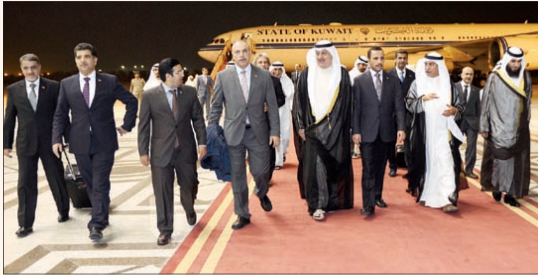
رئيس مجلس الأمة مرزوق الغانم والوفد المرافق له خلال عودته من الجولة البرلمانية في سويسرا وإيطاليا وفي استقباله عادل الخرافي وعيسى الكندري

وضم الوفد البرلماني المرافق للغانم كلا من وكيل الشعبة النائب فيصل الشايح وأمين سر الشعبة النائب د.عودة الرويعي وأعضاء الشعبة النواب د.خليل عبدالله وسيف العازمي إضافة الى أمين عام مجلس الأمة علام الكندري.