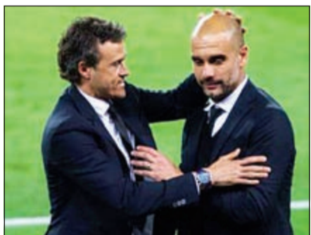
لمن جائزة فرنسا فوتبول؟

أعلنت مجلة «فرانس فوتبول» القائمة التي سيتنافس من خلالها أفضل المدربين في العالم على لقب الأفضل بينهم في عام 2015. وأقادت صحيفة «الموندو ديبورتيفو» الكتالونية ان المدربين المتنافسين هم لويس انريكي (برشلونة)، بيب غوارديولا (بايرن ميونخ)، جوزيه مورينيو (تشلسي)، خورخي سامبولى (منتخب تشيلي)، ارسين فينغر (ارسنال)، ماسيماليانو اليغري (يوفنتوس)، ديبغو سيميوني (اتلتيكو مدريد)، كارلو انشيلوتي (المدرب السابق لريال مدريد). وسيتكون الاختيار بين الأفضل في يوم 11 يناير المقبل في زيوريخ السويسرية خلال حفل الكرة الذهبية الذي ينظمه الفيفا سنويا. وتبدأ فترة التصويت من 26 أكتوبر الجاري وتنتهي في 20 نوفمبر المقبل قبل ان يكون في 30 نوفمبر الاعلان عن أفضل ثلاثة مدربين من كل فئة.