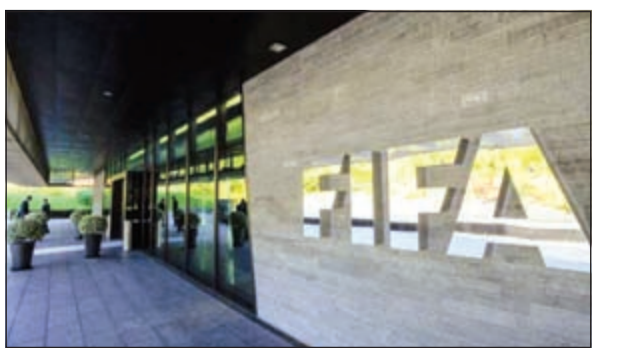
مقر الاتحاد الدولي لكرة القدم