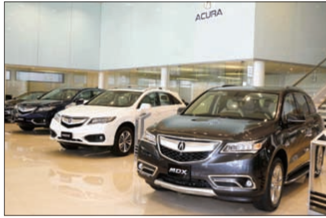
معرض ACURA في الري