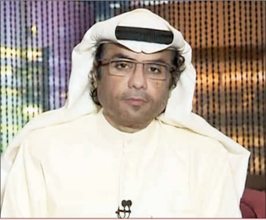
الإعلامي المحامي خالد العبدالجليل