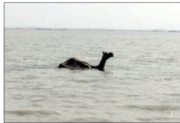
الناقة كادت تغرق

على ما يبدو للاستحمام او للهرب من الاجواء الحارة في بحر فكاتت تغرق. وبحسب مصدر أمني فإن عمليات «الداخلية» تلقت بلاغا من مواطن حول غرق ناقة في بحر الخويسات على طريق الصبية، وعلى الفور توجه الى موقع البلاغ رجال امن الطرق الشمالية والذين طلبوا مساعدة الاطفائيين لإنقاذ الناقة.