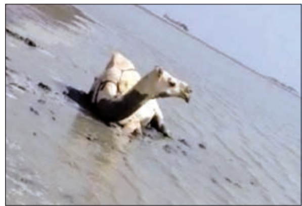
الناقة بعد إنقاذها

على ما يبدو للاستحمام او للهرب من الاجواء الحارة في بحر فكاتت تغرق. وبحسب مصدر أمني فإن عمليات «الداخلية» تلقت بلاغا من مواطن حول غرق ناقة في بحر الخويسات على طريق الصبية، وعلى الفور توجه الى موقع البلاغ رجال امن الطرق الشمالية والذين طلبوا مساعدة الاطفائيين لإنقاذ الناقة.