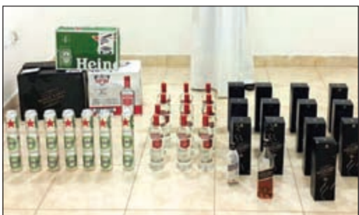
الخمور التي ضبطت مع شخص بالروضة