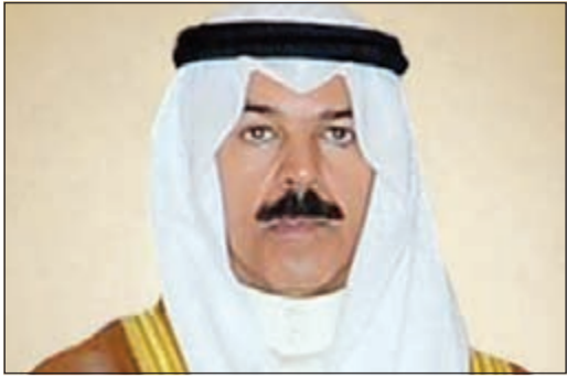
الشيخ محمد الخالد

أصدر نائب رئيس مجلس الوزراء ووزير الداخلية الشيخ محمد الخالد قرارا وزاريا بتعديل مسمى إدارة المكتب الفني بالإدارة العامة لمكتب وزير الداخلية ليصبح «إدارة ديوان الوزارة».