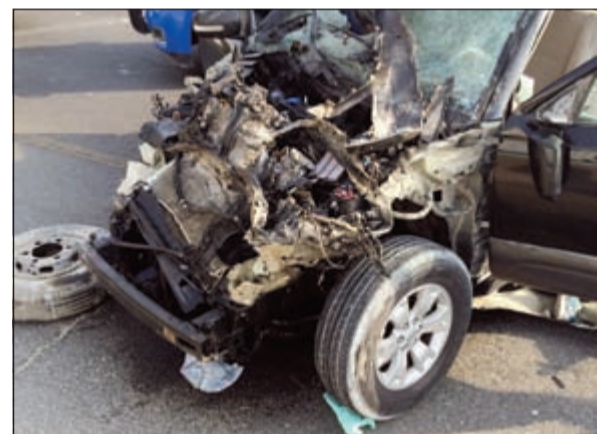
السيارات التي اصطدمت على «السادس»

تحقيقا للوقوف على سبب الحادث. وكان رجال الاطفاء والعنزي قد توجهوا إلى مكان الحادث وتبين ان الشخصين توفيا نتيجة إصابات بالغة لحقت بهما.