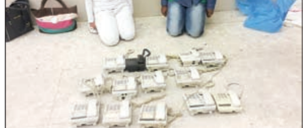
الوافدتان الإثيوبيتان المتهمتان بسرقة المكالمات

أوقف رجال أمن الفروانية نشاط عدد من الوافدات في مخالفة القانون وإدارة أوكار لسرقة المكالمات الدولية وتمت إحالة المتهمات إلى جهة الاختصاص. وقال مصدر أمني إن معلومات وردت إلى مدير أمن الفروانية اللواء فهد الشويح عن قيام وافدة بإدارة وكسر لسرقة الاتصالات الدولية في منطقة خيطان فتم تشكيل قوة والتأكد من صحة المعلومة حيث تبين أن الوكر تديره إثيوبية تم ضبطها والتحقق على الإجهزة، وما ان انتهى رجال الأمن من ضبط الوافدة حتى تم اكتشاف وكريين آخرين فيه 3 وافدات أيضا يقمن بسرقة المكالمات الدولية.