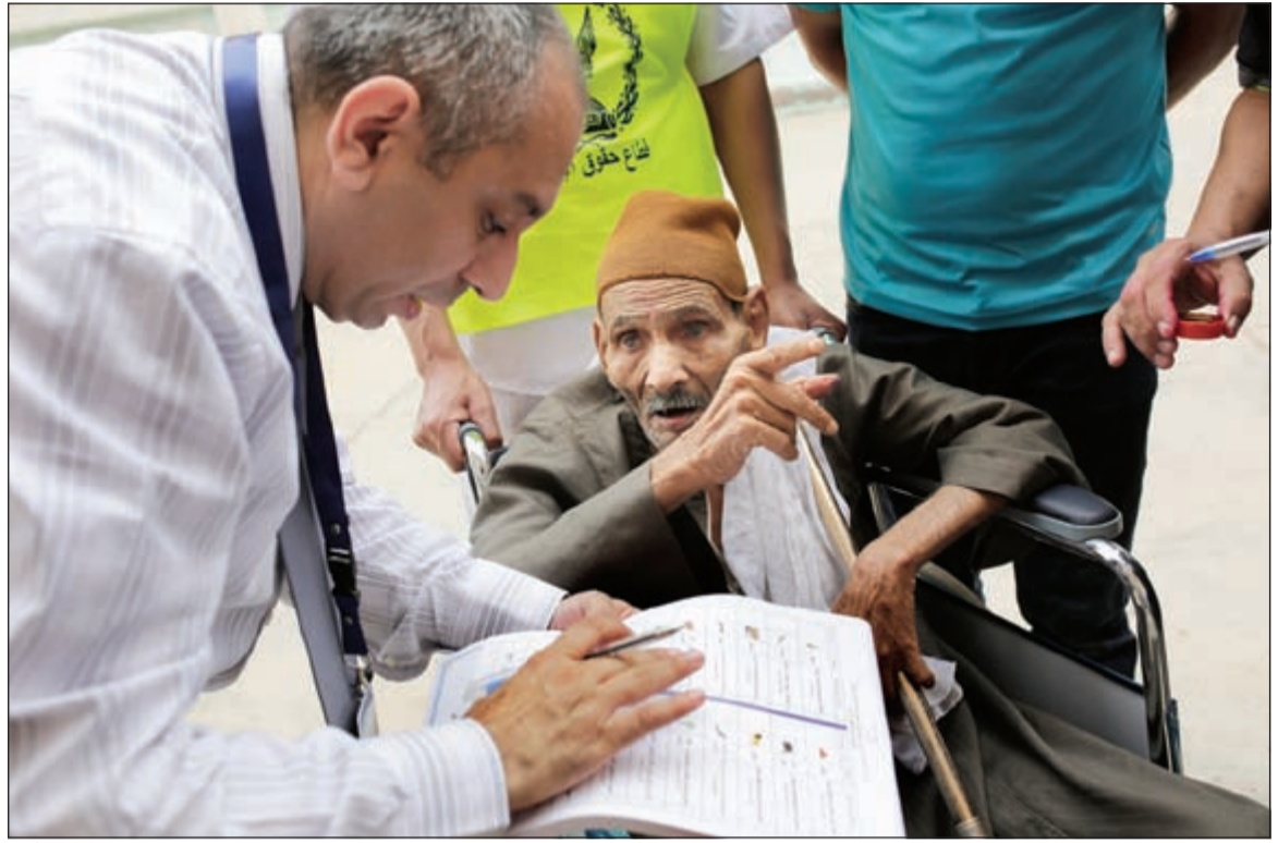
كبار السن والسيدات التواجد الأكبر في التصويت على مدار يومي المرحلة الأولى

القاهرة - أ.ش.: شهدت عملية التصويت في اليوم الثاني من المرحلة الأولى للانتخابات البرلمانية في مصر والتي جرت أمس، إقبالا محدودا من الناخبين فيما شهدت بعض الدوائر واللجان بمحافظات الصعيد إقبالا جيدا بسبب الطبيعة القبلية والعشائرية للمرشحين، حيث قال مستشار رئيس الوزراء لشؤون الانتخابات اللواء رفعت قمصان إن نسبة المشاركة في بعض المحافظات على مدار اليوم الثاني وصلت لـ 25% ومتوقعا زيادة نسبة الإقبال قبل غلق باب الانتخابات.