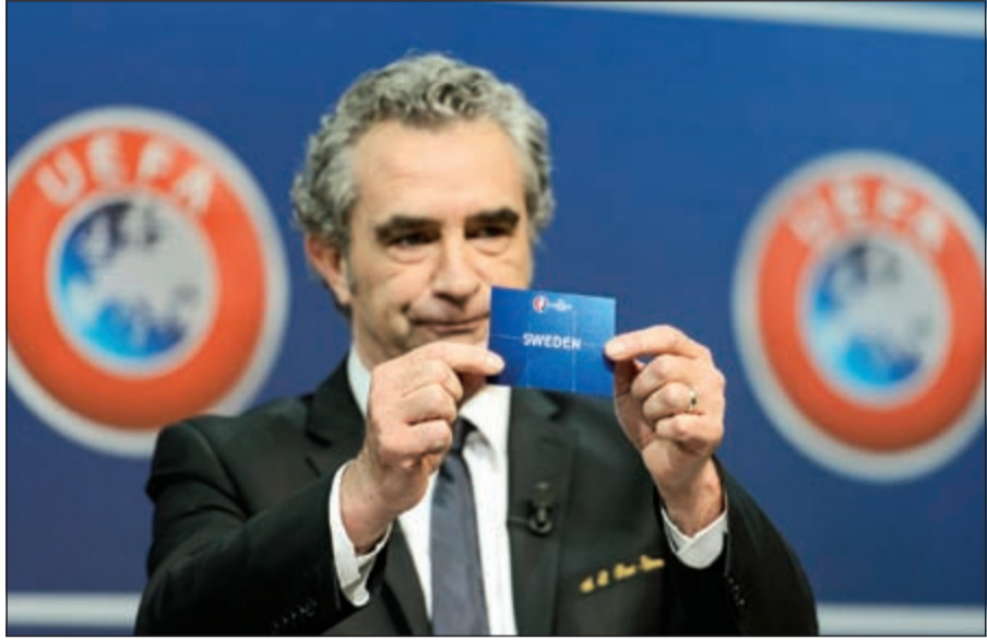
النجم الفرنسي السابق روشو يسحب القرعة

بينما قام بعملية السحب، دومينيك روشو الفائز مع المنتخب الفرنسي بلقب يورو 1984.