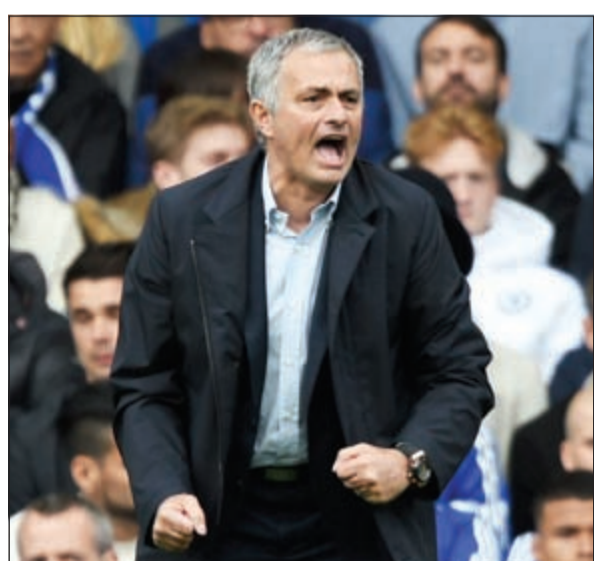
«سبيشال ون» يوجه لاعبيه

اعترف المدير الفني لتشلسي جوزيه مورينيو بأن فريقه ليس الأفضل في الدوري الإنجليزي الممتاز هذا الموسم رغم الفوز في المباراة أمام استون فيلا.