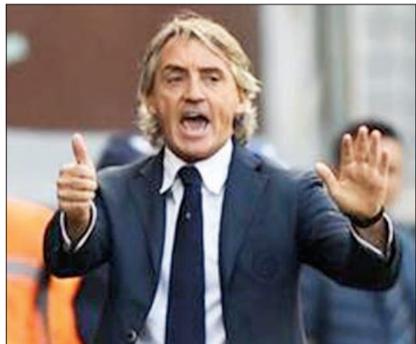
صفقة مدوية ينتظرها عشاق انتر ميلان

ويقدم انتر موسما مختلفا عن الموسم الخمس الماضية منذ ان عاد مانشيني وقام