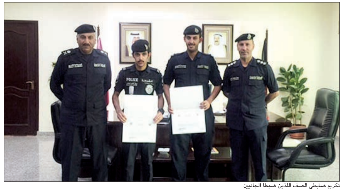
تكريم ضباط الصف الذين ضبطوا الجاني

وكيل أول ضابط) الحاصلين على شهادة الثانوية العامة أو ما يعادلها مطالبون بالتقدم إلى الإدارة العامة لشؤون قوة الشرطة لتقديم ما يثبت ذلك خلال الفترة من 18 - 22 أكتوبر الجاري. كذلك أعلنت الداخلية عن عقد دورة تدريبية أخرى لترقية ضباط الصف من حملة المؤهلات الجامعية، أو ما يعادلها ويستلزم الحصول عليها دراسة مهنتها أربع سنوات على الأقل بعد الثانوية العامة إلى رتبة (ملازم).