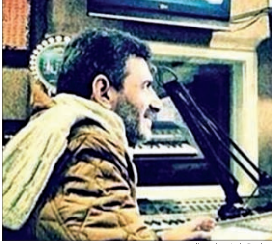
القنان الراحل جاسم الغريب

وأكدت المحكمة في حيثيات حكمها أن دعوى سحب الجنسية الكويتية من عائلة البرغش تدخل في نطاق الحقوق المستمدة كونهم يحملون