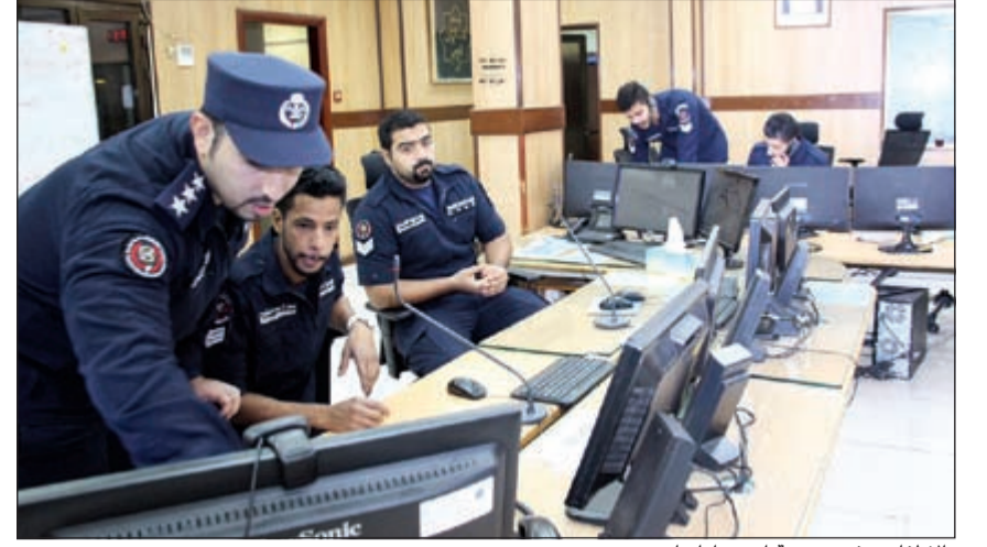
«الإطفاء» رفعت درجة استعداداتها

العاصفة واهمها مصرع شخصين غرقاً، وقالت إن فرق البحث والإنقاذ العمل باشرت منذ اللحظة الأولى من تلقي البلاغات وكان أبرزها حادثتين، الأولى غرق قارب في منطقة خور الصبية بالقرب من جسر الشيخ جابر الأحمد وعلى متنه أربعة أشخاص نجا منهم ثلاثة فيما انتشل زورق خفر السواحل جثة الشخص الرابع، أما الحادثة الثانية فكانت بالقرب من أبراج الكويت، حيث انقلب قارب يستقله مواطنان وهما شقيقان تمكن أحدهما من السباحة إلى الشاطئ وتم إنقاذه من قبل رجال الإسعاف الذين نقلوه إلى المستشفى الأميري وحالته مستقرة، أما