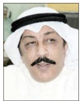
اللواء عبدالحميد العوضي

عنه كعادته فاتصلت به ولم يرد، فسارعت إلى الساحة الترابية لأجد ابني يصارع الموت. وما إن سجلت قضية قتل حتى قامت الإدارة العامة للمباحث الجنائية بالبحث عن الجناة دون جدوى، وجاء الفرج أمس الأول حيث رصدت دورية بقيادة وكيل عريف محسن العنبي ووكيل عريف بدر العنزي قيام شخصين بتفتيش وافد، وتوجهت الدورية إلى مكان التفتيش إلا أن المتهمين حاولا الهرب بالجري على الأقدام فتمت مطاردتهما، والقبض على أحدهما، وبالتحقيق معه بحضور مدير عام مديرية أمن الفروانية اللواء فهد الشوعب قائد منطقة الفروانية العقيد صلاح الدعاس،