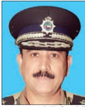
اللواء عبدالله الهنتا

وافداً للإبعاد لقيامهم المركبة دون الحصول على رخصة. وأكدت الإدارة العامة للمرور استمرار حملاتها المخالفة لضبط الحركة المرورية على الطرق الرئيسية والفرعية لضمان الالتزام بالقوانين واللوائح المعمول بها للحد من المخالفات الجسيمة والإسهام في المحافظة على أرواح قائدي المركبات من المواطنين والمقيمين والقضاء على كل الظواهر السلبية.