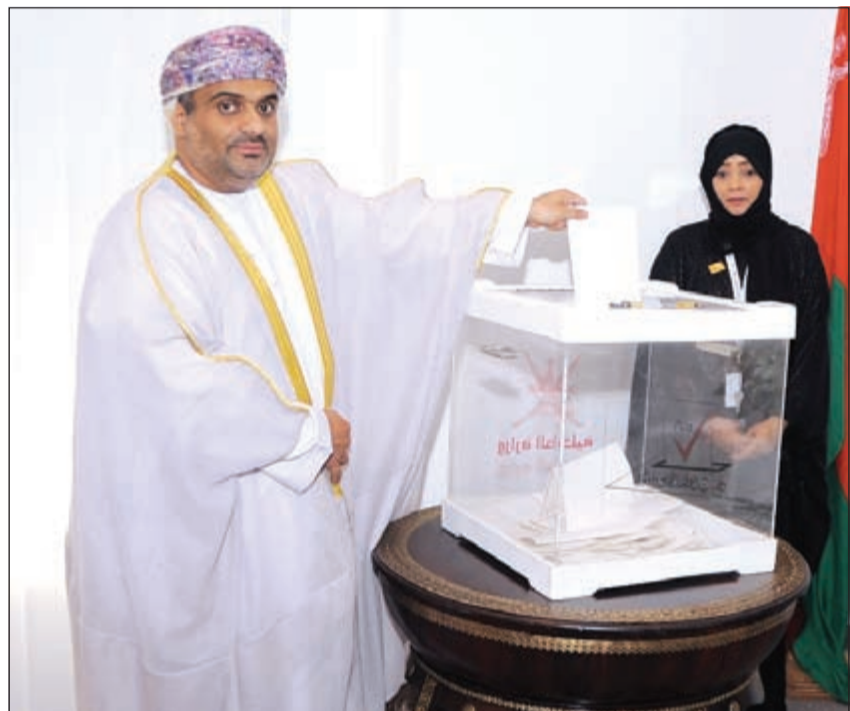
السفير حامد بن سعيد آل إبراهيم يبدلي بصوته