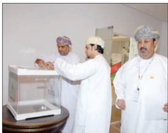
أحد أبناء الجالية العمانية يشارك في العملية الديمقراطية