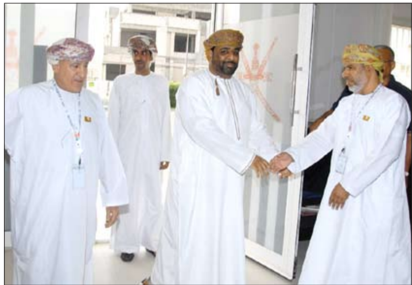
إقبال من الأشقاء العمانيين على المشاركة في الانتخابات

ثمن السفير العماني لدى الكويت حامد بن سعيد آل إبراهيم التسهيلات التي لقيتها السفارة من الحكومة الكويتية لإتمام عملية اقتراع أبناء الجالية لاختيار أعضاء مجلس الشورى العماني في الانتخابات التي انطلقت أمس في سفارات السلطنة بدول مجلس التعاون الخليجي، مشيداً بالعلاقات العمانية الكويتية ووصف إياها بالمتينة والتاريخية فضلاً عن كونها علاقة أشقاء مميزة بفضل حكمة قادة البلدين الشقيقين. وفي تصريح صحافي على هامش انتخابات مجلس الشورى العماني، التي عقدت أمس بمقر السفارة العمانية بمنطقة السلام، ذكر السفير آل إبراهيم أن عدد المواطنين العمانيين بالكويت يصل إلى 4000 مواطن ما بين عامل وطلب، موضحاً أنه تم إبلاغهم جميعاً بموعد الانتخابات، لنتسني لهم المشاركة في هذا العرس الديمقراطي، مشيداً بالاستجابة السريعة من أبناء الجالية العمانية بالكويت للمشاركة في الانتخابات.