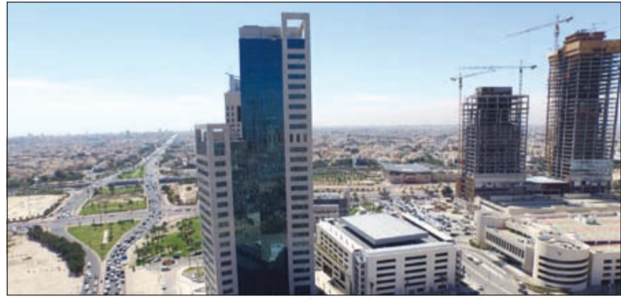
مشروع المقر الرئيسي لهيئة شؤون القصر وقد اكتمل بنسبة 99%