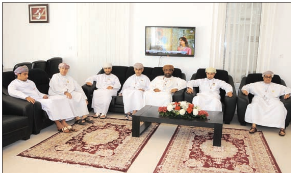
عدد من الأشقاء العمانيين في سفارة بلادهم خلال عملية الاقتراع