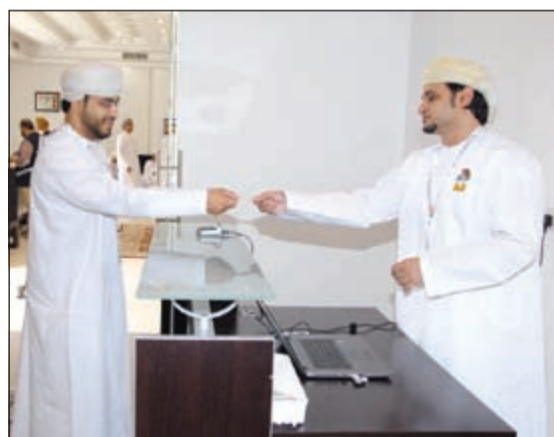
جانب من عملية التصويت

القرارات اللازمة، مؤكداً في الوقت نفسه أنه ليس هناك قرارات منفصلة دون الرجوع لمجلس الشورى. الجدير بالذكر أن مجلس الشورى العماني أنشئ في عام 1991 ليكون بديلاً عن مجلس استشاري كان موجوداً منذ 1981، ويضم المجلس ممثلي ولايات سلطنة عمان