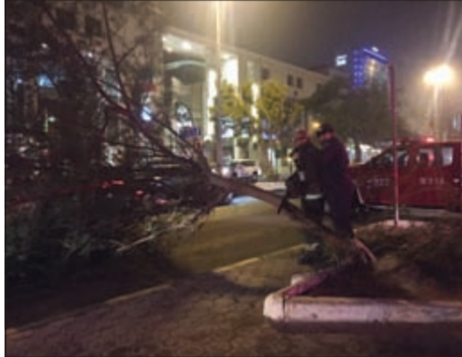
أشجار وقد تساقطت بفعل الرياح