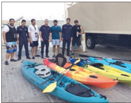
رجال الإطفاء والأشخاص الذين تم إنقاذهم