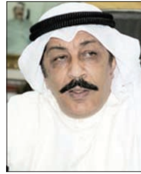
الواء عبدالحميد العوضي

3000 دينار وهي متحصلات بيع الخمر، وقد اعترف بالتحقيقات بحيازته للخمر لالتجار وتمت إحالته الى جهة الاختصاص. وأكد المصدر ان ضبط المتهم جاء عقب تحريات موسعة اكدت امتهان «البدون» الاتجار في المواد المسكرة المستوردة منذ فترة، حيث اطلق عليه السكارى «أسطورة المستورد» مستغلا ارتفاع سعرها بسبب شح المعروض، حيث تم التنسيق مع النيابة العامة وتقديم المبلغ المالي للمتهم بعد ان اطلعت النيابة العامة على ارقام المعاملات التي قدمها رجال المباحث الى المتهم «البدون» ليضبط متلبسا.