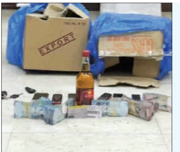
المضبوطات احيات للاختصاص

وبعد التفتيش الدقيق عثر رجال الجمارك على 4 كيلو من الحشيش مخبأ في شاصي السيارة، وأمر البراك بإحالة المضبوطات والهتدي الى جهات الاختصاص.