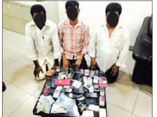
الوافدون الثلاثة وامامهم الهواتف غير معلومة المصدر