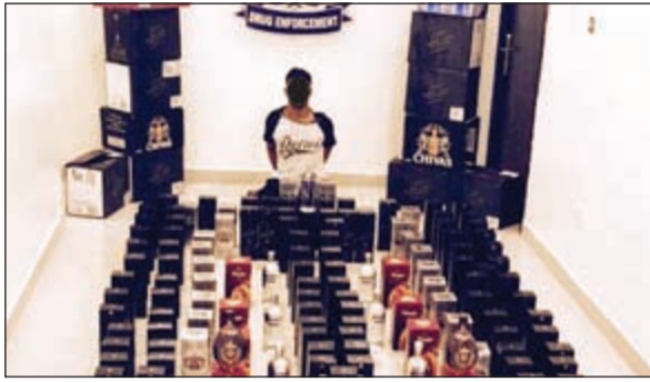
المتهم البدون وامامه المضبوطات من الخمر المستوردة

3000 دينار وهي متحصلات بيع الخمر، وقد اعترف بالتحقيقات بحيازته للخمر لالتجار وتمت إحالته الى جهة الاختصاص. وأكد المصدر ان ضبط المتهم جاء عقب تحريات موسعة اكدت امتهان «البدون» الاتجار في المواد المسكرة المستوردة منذ فترة، حيث اطلق عليه السكارى «أسطورة المستورد» مستغلا ارتفاع سعرها بسبب شح المعروض، حيث تم التنسيق مع النيابة العامة وتقديم المبلغ المالي للمتهم بعد ان اطلعت النيابة العامة على ارقام المعاملات التي قدمها رجال المباحث الى المتهم «البدون» ليضبط متلبسا.