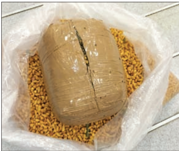
مخدّر الماريغوانا اخفي في لفافة ظاهرها مسكرات هندية