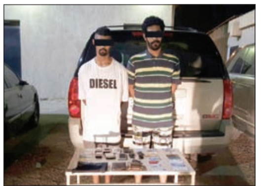
اللسان وشريكهما الثالث هارب وتبدو امامهما وخلفهما السرقات