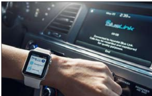
معلومات سوق دبي المالي متاحة عبر الوسائل الذكية

أعلن سوق دبي المالي، طرح فرصة للجمهور والمتعاملين لعيش تجربة «البورصة الذكية» من الفها إلى يائها تحت شعار «معكم أينما كنتم ووقتما شئتم»، داخل جناح حكومة دبي بمعرض جيتكس لتكنولوجيا المعلومات الذي يقام بمركز دبي التجاري العالمي خلال الفترة من 18 إلى 22 من أكتوبر الجاري.