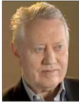
جيمس فرانسيس فيثي