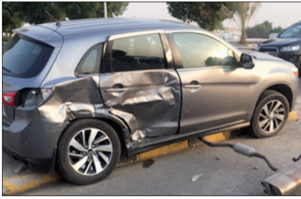
المركبة المتضررة في حادث الجهراء