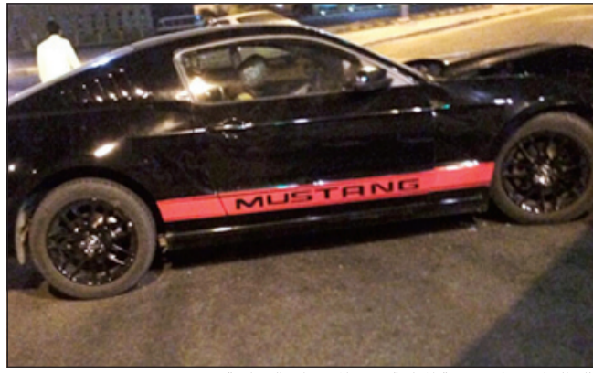
آثار الحادث على مقدمة المركبة قرب المجمعات التجارية