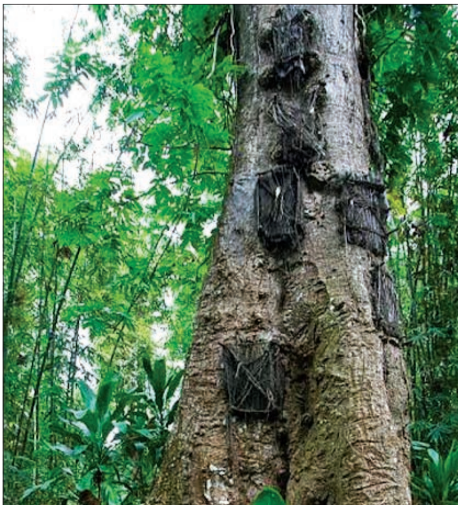
مدافن للرضع في جدوع الشجر

مستعدين بورق سعف النخيل. ويعتقد أهالي القرية أن دفن أطفالهم داخل جدوع الأشجار الحية، والتي تندمل تجاوبها مع مرور الوقت، ستساهم في امتصاص الطبيعة لأجساد أطفالهم، فيما تقوم الرياح بحمل أرواحهم. ولبست هذه الشجيرة الوحيدة المخيرة للاستغراب من أهالي قرية «تانا توراجا»، حيث اشتهرت بطقوس غريبة متعلقة أيضا بالموتى، حيث اعتاد أهلها نبش قبور أسلافهم وأخذ جثثهم في جولة حول القرية، بعد أن يقوموا بغسلهم وتبديل ملابسهم في احتفال ديني يقام كل ثلاث سنوات.